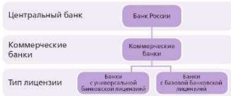
Рисунок 1. Трехуровневая российская банковская система

Но давайте рассмотрим вопрос о банковской системе РФ по порядку, сначала выяснив, какие функции выполняет Банк России.