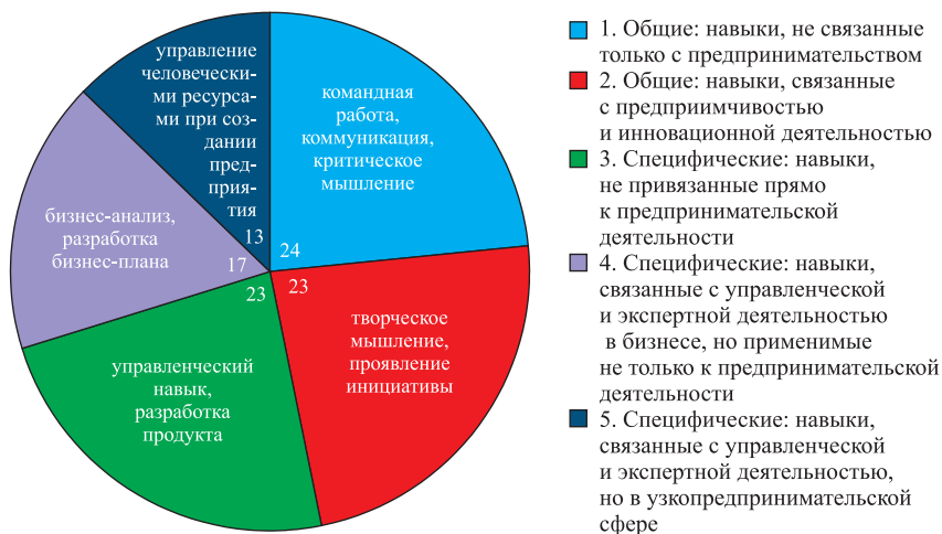
Рис. 5. Количественное распределение навыков для всех проанализированных курсов и программ в магистратуре (с примерами), %