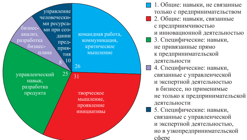
Рис. 2. Количественное распределение навыков для всех проанализированных программ (с примерами) (бакалавриат+магистратура), %