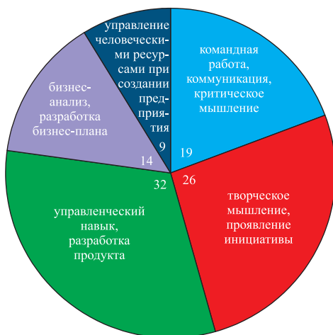
Рис. 3. Количественное распределение навыков для всех проанализированных курсов с примерами (бакалавриат+магистратура), %