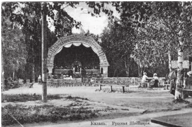
Сад «Русская Швейцария», Казань. Начало XX века

парках и рощах (одесский Малый фонтан, «Русская Швейцария» в Казани, Санников сад в Омске, Новопоселенский сад в Ростове-на-Дону и другие). Обычно в эти сады ходила состоятельная публика, имевшая возможность оплатить дорогу, и жители близлежащих дач.