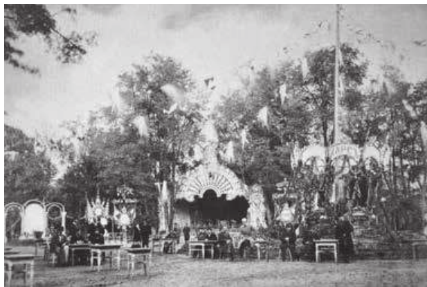
«Эрмитаж» М. В. Лентовского на Божедомке, Москва. 1879