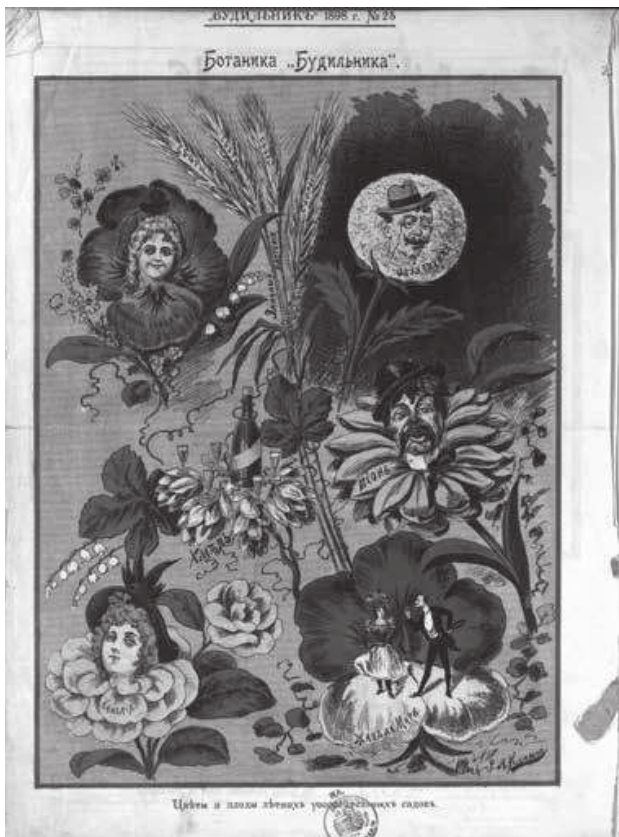
Иллюстрация из журнала «Будильник», 1898, № 25

садах проводились специальные детские экскурсии.