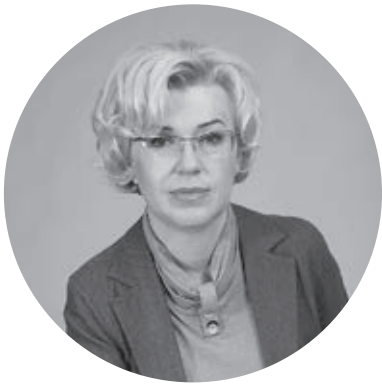
Ольга Николаевна Епифанова, председатель Комитета Госдумы по вопросам семьи, женщин и детей, координатор Депутатской группы по связям с парламентом Республики Корея