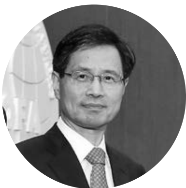
Пак Ро Бёк, Посол Республики Корея в Российской Федерации