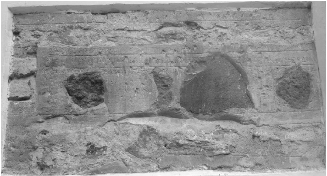
Рис. 4. Южный фасад. Спасский собор в Чернигове, Украина.

графически близкой к эгейскому миру и его до-«элладской» и «элладской» школам.