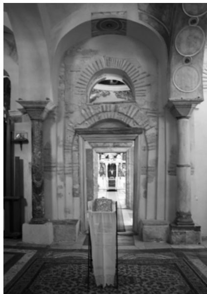
Рис. 2. Восточная стена экзонартекса. Кафоликон Неа Мони на Хиосе, Греция.

размещены здесь на северном и южном фасадах (в завершениях и над окнами боковых прясел), а также на западном над входом, который теперь находится внутри экзонартекса (Рис. 2). В экзонартексе арки опираются на приставленные к стенам колонны; в наосе функцию пилястров первоначально также исполняли тонкие спаренные колонки в два яруса. На фасадах активно использована разгранка по цемянке под квадраты, с имитацией не только квадратов, но и швов между ними. Но в Неа Мони керамопластическая декорация фасадов намного богаче, чем в Мирах: она включает в себя также псевдомеандр, плоские ниши разной формы (в том числе в виде «сердечка»), усложнённые солнцобразные орнаменты, различное орнаментальное заполнение закомар.