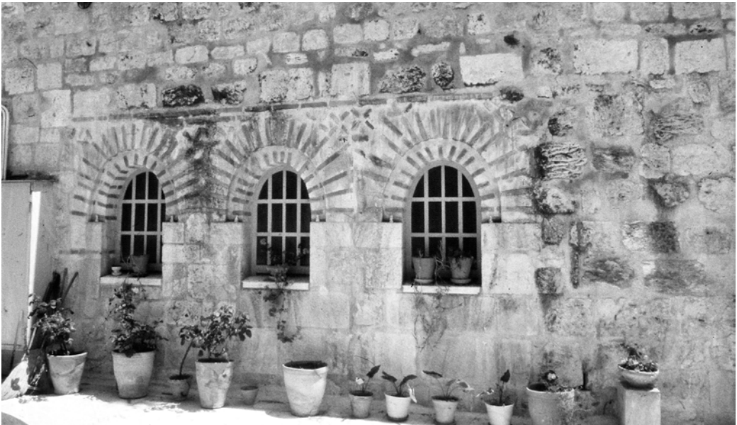
Рис. 3. Северный фасад ротонды. Храм Гроба Господнего в Иерусалиме.

орнаментами из плинфы (Рис. 3), а тромпы «приподнятой капеллы» (Elevated chapel) — W-образными. Но встречаются здесь и архитектурные элементы иного характера: на куполе той же капеллы снаружи поставлены пучковые пилястры (в комбинации из двух треугольных и одного полукруглого посередине), а сам купол, своды капеллы и часть стен храма сложены в технике opus mixtum , в том числе с использованием кладки со скрытым рядом.