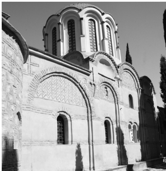
Рис. 1. Южный фасад. Кафоликон Неа Мони на Хиосе, Греция.