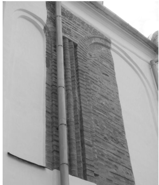
Рис. 5. Южный фасад. Спасский собор в Чернигове, Украина.

Так, на стенах епископии в Олимпе мы видим солнцеобразные орнаменты, поребрик и другие декоративные элементы [9]. «Полосатые» арки из камня и кирпича, известные ещё с римского времени (см., например, арки над окнами Каср-аш-Шам в Каире [6, р. 74, fig. 18] 2 ), мы встречаем на ряде ранневизантийских памятников Ликийи, причём в разных локациях: в арочных завершениях окон (апсиды храмов на о. Какава (совр. Кекова) и Олуклу Тепе, перистиль епископии в Олимпе), проёмов (дом в Панорме (совр. Сарыгерме), епископия в Олимпе), ниш (епископия и «здание с мозаиками» в Олимпе, где они сочетаются с другими видами фигурной кладки