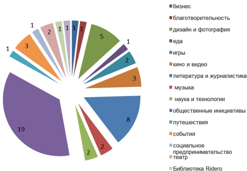
Рис. 1. Количество проектов на платформе Планета.ру, связанных с музейной деятельностью

связанные с созданием частных музеев на основе каких-либо коллекций или в виртуальном пространстве, а также с применением информационных технологий в музейной деятельности (3D-технологии, интерактивные и виртуальные музеи и др.).