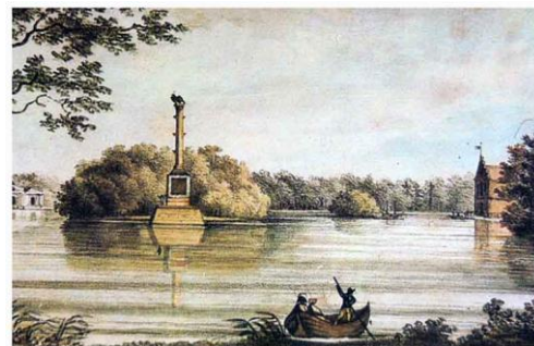
Рисунок 5. Лангре. Чесменская колонна, ок. 1820

И, в думу углублен, над злачными берегами Сидит в безмолвии, склоняя ветрам слух. Протекшие лета мелькают пред очами, И в тихом восхищенье дух. Он видит: окружен волнами, Над твердой, мишистою скалой Вознесся памятник. Ширяся крылами, Над ним сидит орел молодой. И цепи тяжкие и стрелы громовые Вкруг грозного столпа трикратно обвились; Кругом подножия, шумя, валы седые В блестящей пене улеглись.