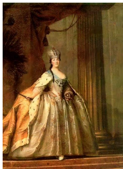
Рисунок 4. Стефано Торелли. Екатерина II в образе Минервы, покровительницы искусств. 1770. Государственный Русский Музей

В январе 1763 года, то есть спустя полгода после того, как Екатерина II в результате дворцового переворота пришла к власти, в Москве состоялось пышное пятидневное торжество в ее честь. Центральным событием этих дней стало тщательно подготовленное театрализованное действо, трехдневный «народный маскарад», под названием «Торжествующая Минерва». Представление было приурочено к масленичным гуляниям и проходило на улицах города для всего московского люда. О масштабе праздника говорят цифры – в представлении было задействовано почти четыре тысячи актеров, хористов и статистов; по улицам города передвигалось двести колесниц-платформ, на которых изображались живые картины, располагались хоры и оркестры. Задача, которую Екатерина II поставила перед организаторами и авторами этого действа Ф. Волковым, П. Елагиным, М. Херасковым, А. Сумароковым и другими, была в том, чтобы показать добродетели торжествующей победу императрицы Минервы и предсказать будущее процветание