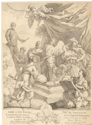
Рисунок 3. На гравюре, представляющей собой зеркальную копию живописного полотна Л.-Ж.-Ф. Лагрене богиня мудрости, покровительница искусств и ремесел Минерва (так же, как и крылатый Гений) находится за спиной Елизаветы Петровны. Кроме того, императрицу окружают аллегорические фигуры живописи (с кистями и палитрой), скульптуры (с молотком у памятника Петру I), архитектуры (с чертежом), истории (с книгой). Оригинал этой гравюры находится в Государственном Русском музее.

особам. Каждая из преемниц Петра I – Екатерина I, Анна Иоанновна, Елизавета Петровна, а затем и Екатерина II – изображались в виде Минервы или с Минервой-покровительницей.