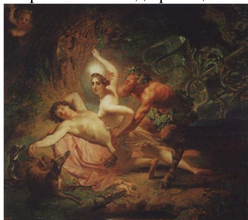
Рисунок 1. К. Брюллов. Диана, Эндимион и Сатир, 1849

Визуальный комментарий к экфразе. Для того чтобы показать возможности современной модификации старого филологического жанра, проще всего было бы выбрать экфрасис.