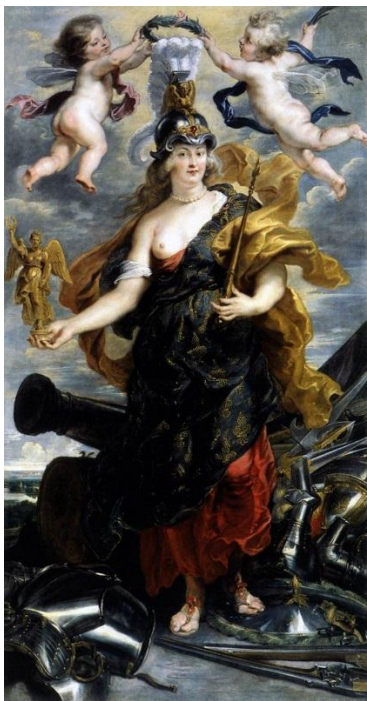
Рисунок 2. Петер Пауль Рубенс. Мария Медичи в образе Минервы, 1622-25. Лувр

Таким образом, то отождествление Екатерины II с Минервой, которое мы видим в стихотворении «Воспоминание...», вполне оправдано: она и воительница (в том числе Пушкин вспоминает в стихотворении те военные победы России, которые были одержаны в годы правления Екатерины II), она и покровительница искусств и наук, и даже писательница. Но есть еще одна важнейшая причина, по которой Екатерина II названа в стихотворении поэта Минервой и именно Минервой русской .