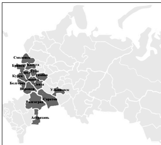
Рис. 1. “Красный пояс” РФ в 1990-е гг.

Какие регионы входят в русский “библейский пояс”? Это регионы Центральной России, отчасти – Южной России и Поволжья, с высокой долей приверженцев православия. Важно подчеркнуть, что ранее эти регионы входили в “красный пояс” России (см. рис. 1). Попытаемся ответить на вопрос, насколько случайным могло бы быть такое совпадение.