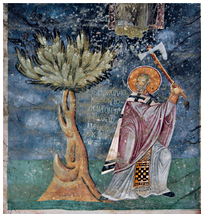
Посещение дерева в Плакоме. Ростись и, в.мч. Георгия в Старо-Нагоричино, Македония. 1317/18 г.