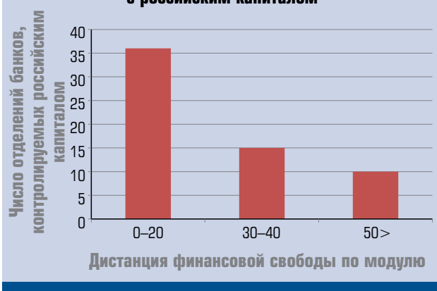
Рис. 2. Дистанция показателей финансовой свободы России и стран функционирования банков с российским капиталом

Преобладающее число отделений отечественных банков расположено в странах с сопоставимым с РФ уровнем финансовой свободы (где разница показателя финансовой свободы не составляет более 20 пунктов). Таким образом, можно предположить, что вероятность выхода банков из России в страны с сопоставимым уровнем финансовой свободы выше.