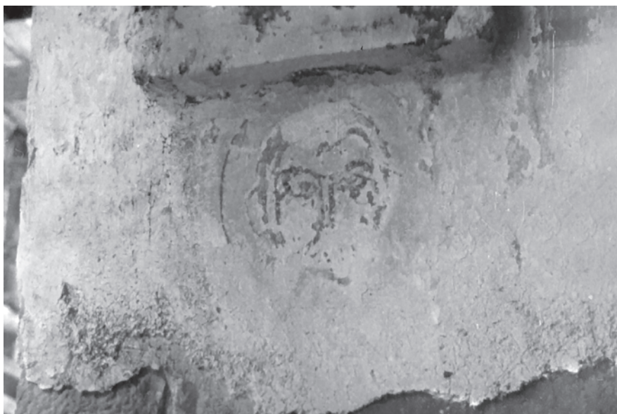
Рис. 3. Остатки фрески на восточной грани северо-восточного столпа Северного храма