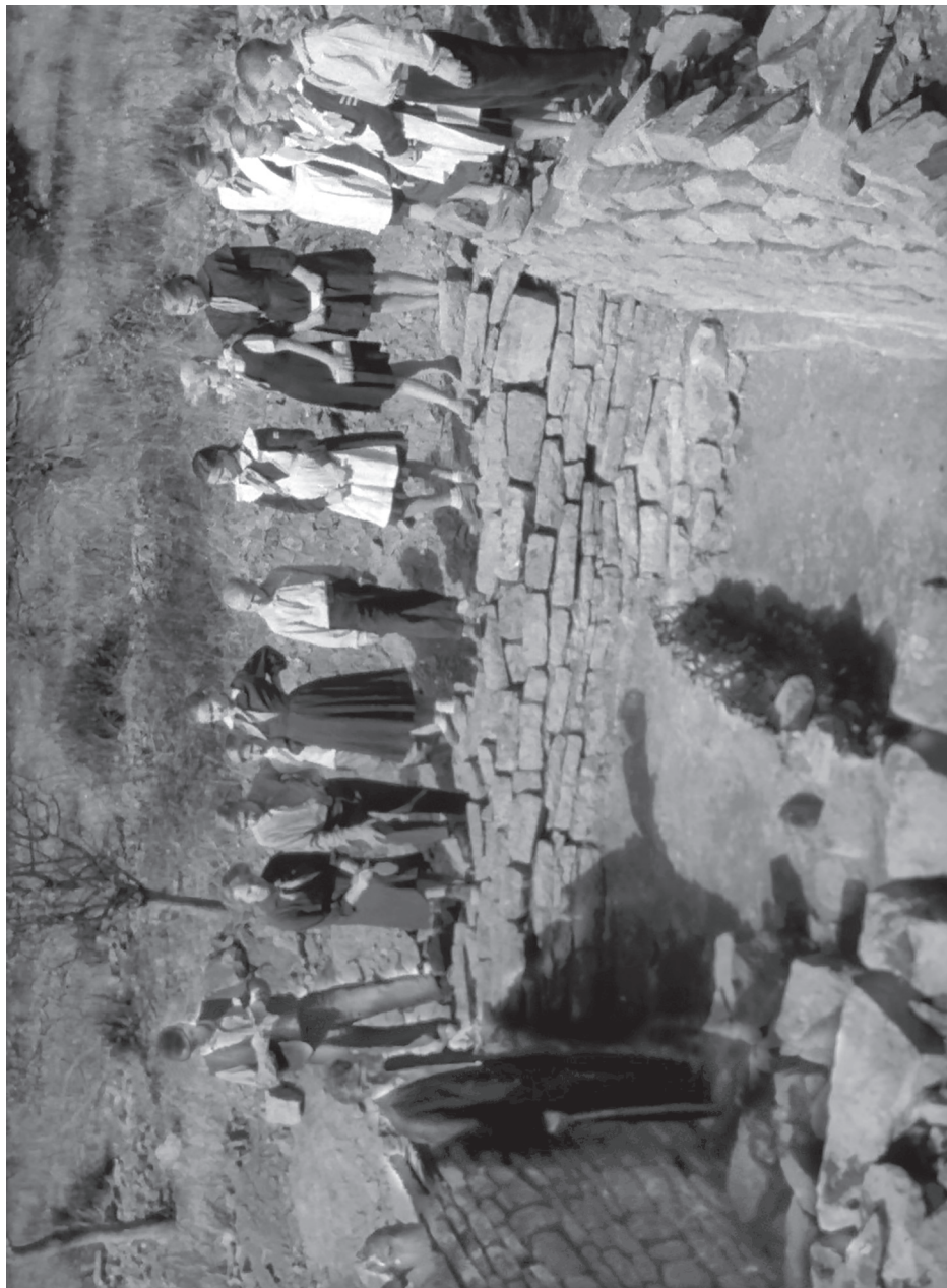
Рис. 5. Экскурсия школьников во главе с М. Н. Ложкиным (вероятно, из Отрадного)