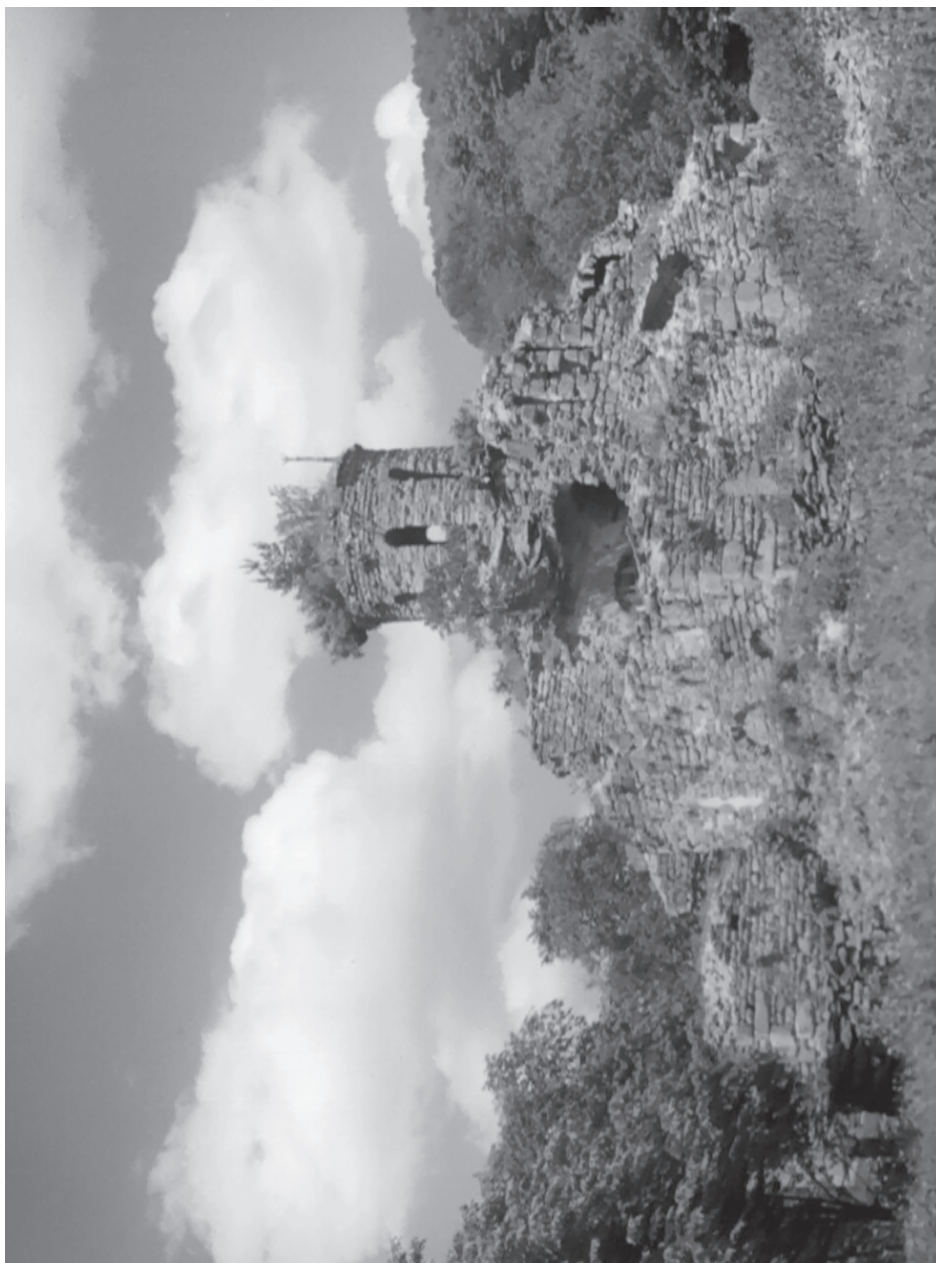
Рис. 1. Северный Зеленчукский храм в процессе раскопок