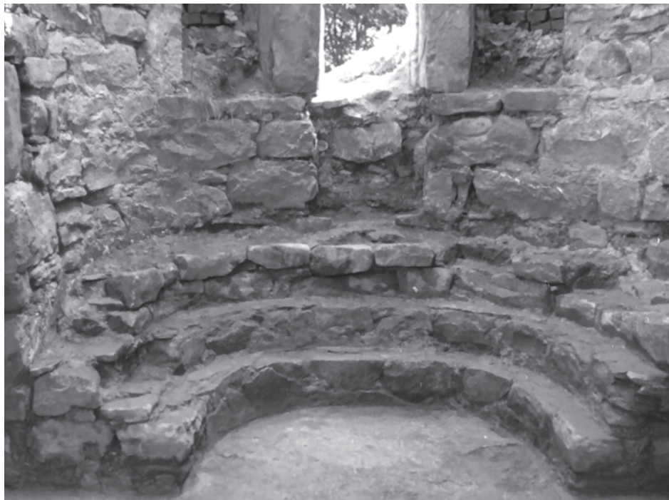
Рис. 2. Центральная апсида Северного Зеленчукского храма