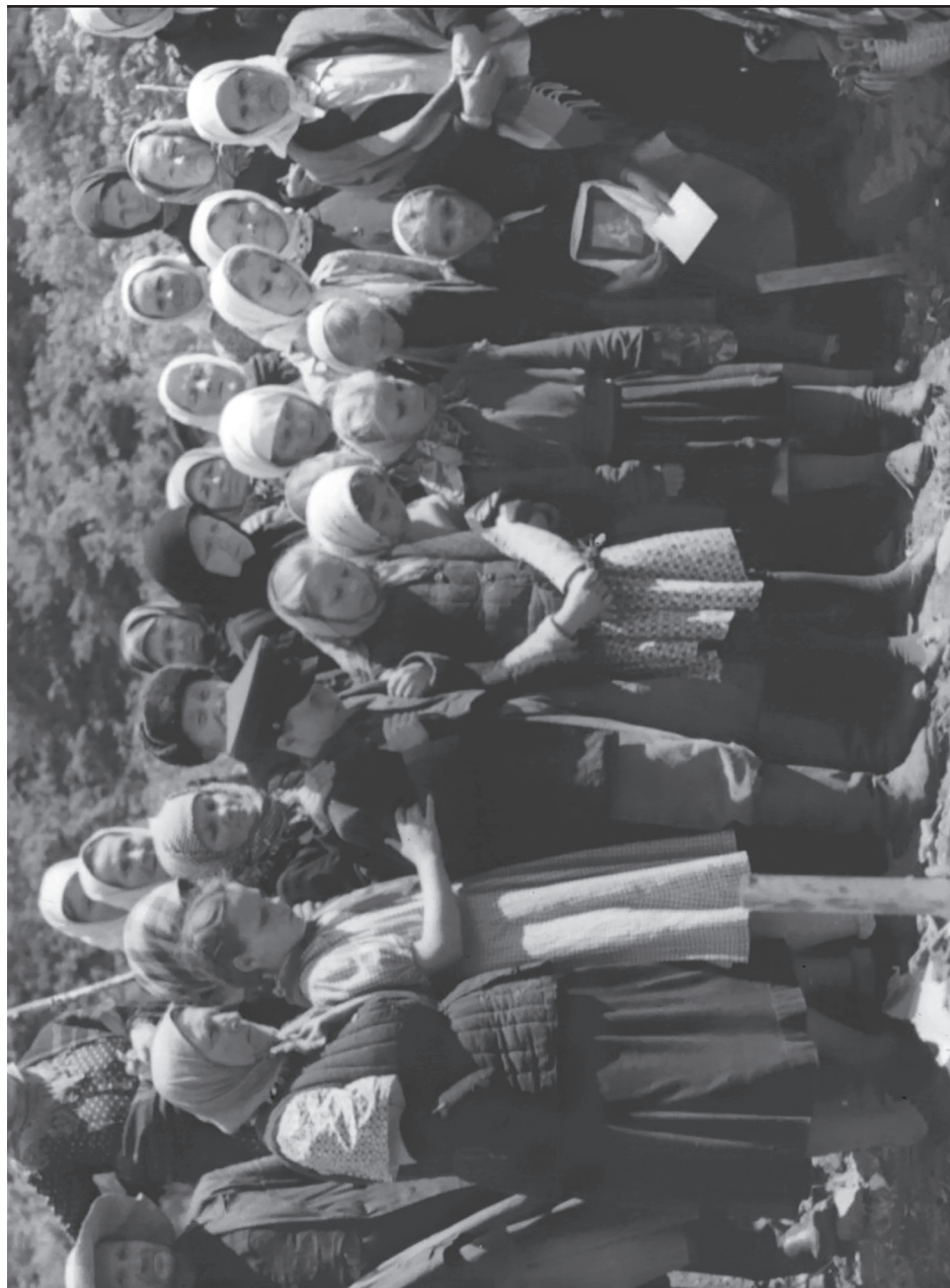
Рис. 6. Своеобразный крестный ход к древнему христианскому храму