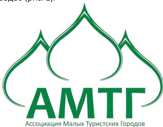
Рис. 1 – Логотип Ассоциации малых туристских городов

Подтверждением этого является создание в 2007 году Ассоциации малых туристских городов (рис. 1).