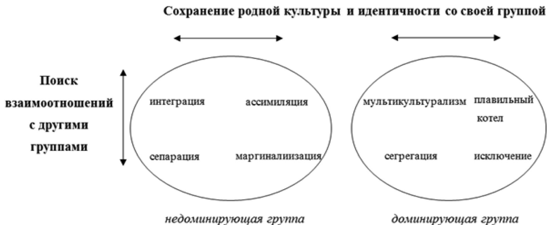
Рис. 2. Стратегии аккультурации, по Дж. Берри [7]

Аккультурационные ожидания представителей принимающего общества были оценены с помощью 16 утверждений [4], образующих 4 шкалы. Пример пункта аккультурационного ожидания «Интеграция» («Мультикультурализм»): «Иммигранты должны владеть в совершенстве и родным, и русским языком»; пример пункта аккультурационного ожидания «Сегрегация»: «Иммигранты должны иметь друзей только своей национальности»; пример пункта аккультурационного ожидания «Ассимиляция»: «Иммигрантам следует участвовать в тех видах деятельности, в которых участвуют только русские»; пример пункта аккультурационного ожидания «Исключение»: «Я считаю, что иммигрантам не важно