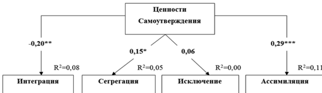
Рис. 6. Путьевая модель взаимосвязи ценностей Самоутверждения с аккультурационными ожиданиями принимающего общества. Параметры модели: CMIN/df=1,52; p=.102; CFI=.95; RMSEA=.05; SRMR=.06.

Примечание: «***» – p < .001; «**» – p < .01; «*» – p < .05 (двусторонняя)