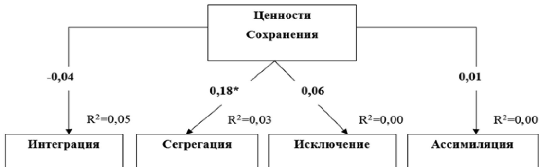
Рис. 5. Путьевая модель взаимосвязи ценностей Сохранения с аккультурационными ожиданиями принимающего общества. Параметры модели: CMIN/df=1,19; p=.277; CFI=.98; RMSEA=.03; SRMR=.05.

Примечание: «***» – p < .001; «**» – p < .01; «*» – p < .05 (двусторонняя)