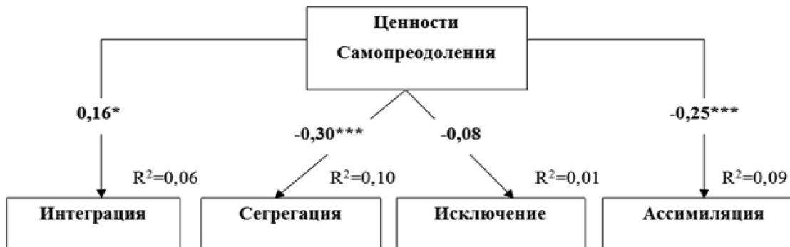
Рис. 4. Путьевая модель взаимосвязи ценностей Самопреодоления с аккультурационными ожиданиями принимающего общества. Параметры модели удовлетворительны: CMIN/df=1,44; p=.127; CFI=.96; RMSEA=.05; SRMR=.06.

Довольно любопытной оказалась роль ценностей Самопреодоления представителей принимающего населения в их аккультурационных предпочтениях. В результате путевого анализа выяснилось, что данные ценности, выражающиеся в принятии других лю-