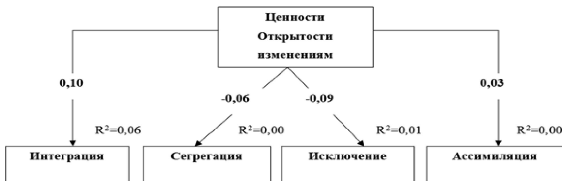
Рис. 3. Путьевая модель взаимосвязи ценностей Открытости изменениям с аккультурационными ожиданиями принимающего населения. Параметры модели удовлетворительны: CMIN/df=1.54; p=.083; CFI=.92; RMSEA=.05; SRMR=.06.

Результаты, представленные на рис. 6, показывают, что ценности Самоутверждения статистически значимо отрицательно связаны с аккультурационным ожиданием «Интеграция» и значимо положительно связаны с аккультурационными ожиданиями «Сегрегация» и «Ассимиляция».