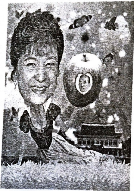
Ли Ха. «Белоснежка Пак Кын Хе». 2012

бусных остановках Пусана. Пак Кын Хе изображена на фоне Голубого дома, в руках она держит очевидно отравленное яблоко, в центре которого нарисован портрет её отца — Пак Чон Хи. Художнику не удалось