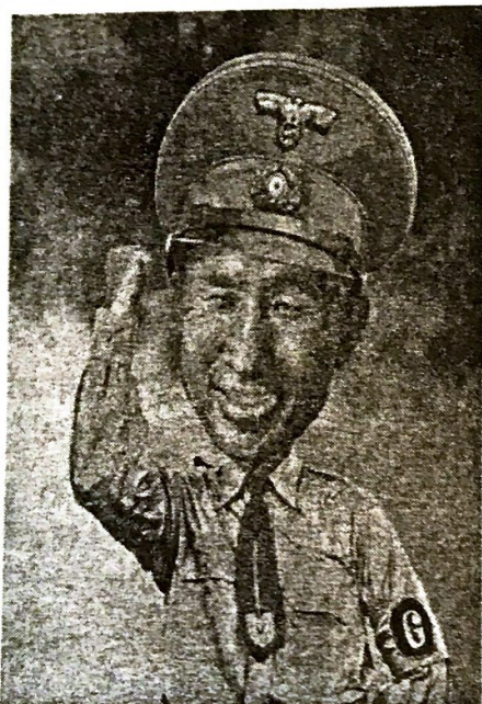
Ли Ха. «Ли Мён Бак» из серии «Милашки-диктаторы». 2010

Мёнбак; «чви» по-корейски означает мышь и созвучно с английской буквой G. Ли Ха также хотел привлечь внимание к несправедливо вынесенному, на его взгляд, приговору преподавателю Пак Чон Сун, который в ноябре 2010 г. нанес изображение мыши на 22 плаката саммита