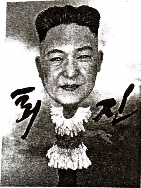
Ли Ха. «Изящная отставка». 2015