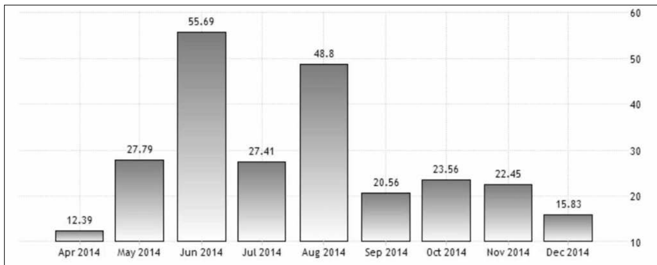
Диаграмма 1. Динамика изменения месячных темпов роста производства обрабатывающей промышленности (% , в пересчете на год, апрель - декабрь 2014 г.).

Примечание: например, число 23,56 над столбиком «Oct. 2014» означает, что в октябре 2014 г. объем производства был на 23,56% выше, чем в октябре 2013 г.