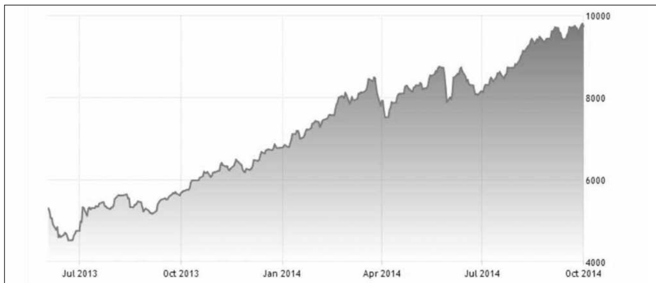
Диаграмма 2. Динамика основного египетского биржевого индекса EGX 30 (июль 2013 - октябрь 2014 гг.).