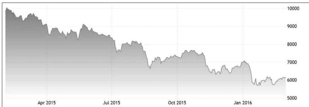
Диаграмма 4. Динамика основного египетского биржевого индекса EGX 30 (апрель 2015 - январь 2016 г.).