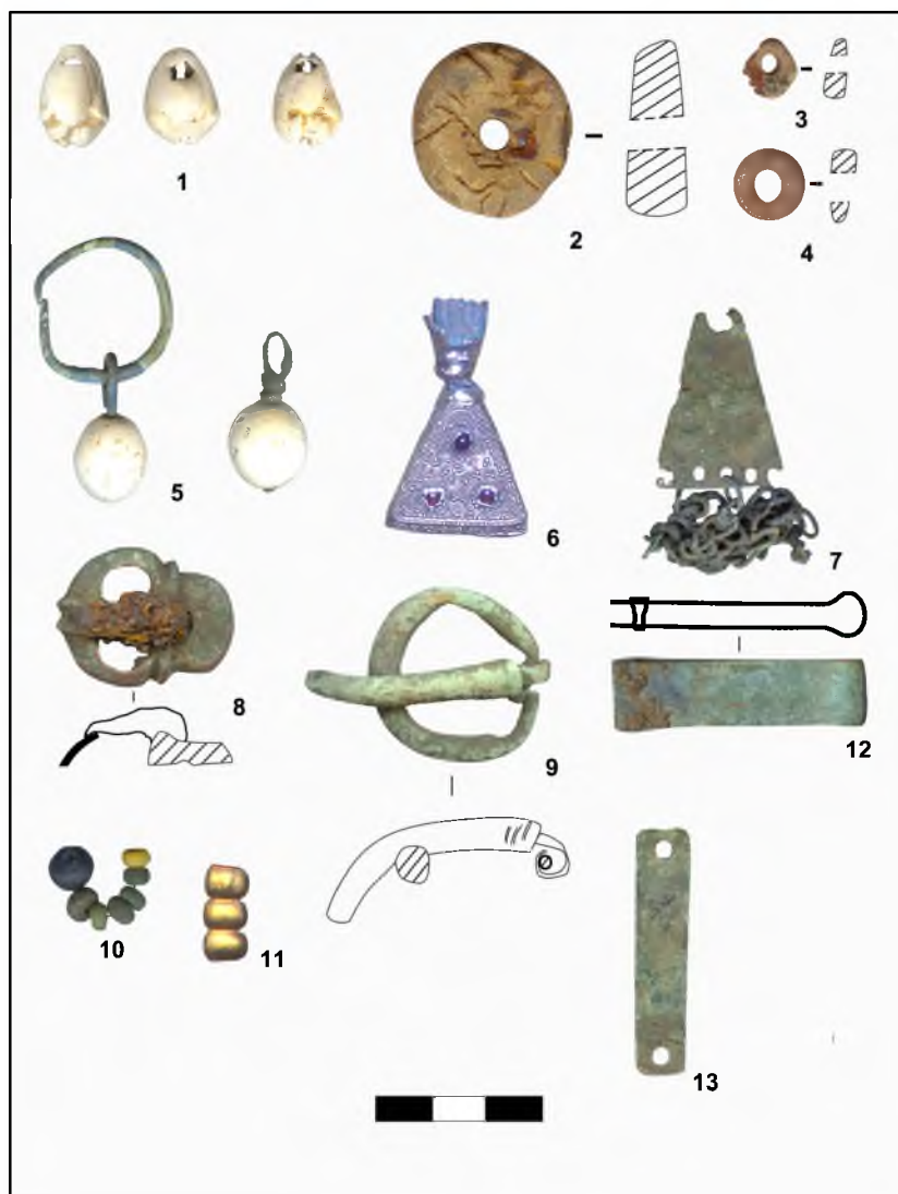
Рис.2. Материалы из раскопок Пыштайнского II могильника (В.А.Оборин) 1–4, 6, 10, 11 – погребение № 8; 5 – погребение № 3; 12, 13 – погребение № 2; 9 – погребение № 6; 8 – пахотный слой.