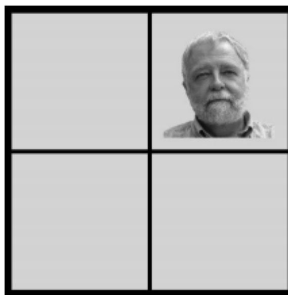
Рис. 2. Одно из лиц, появляющихся после нажатия на слово.

Результаты подсчитывались по алгоритму, описанному в работе А. Greenwald et al. [8]. Вычислялось среднее значение времени реакции в 4 и 7 блоках, разница в средних делилась на обобщенное стандартное отклонение 4 и 7 блоков.