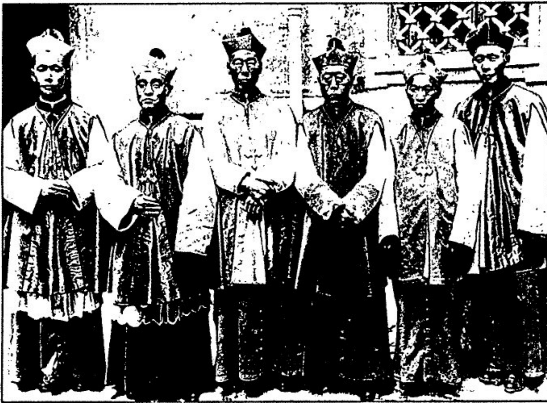
КИТАЙ. Католические епископы-китайцы, посвященные в 1926