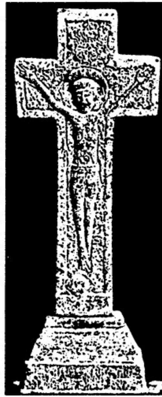
Древний каменный крест, найденный в КИТАЕ во время раскопок в 1937

В Древнем К. были развиты ритуалы, включающие массовые, в т.ч. человек., жертвоприношения, культы божеств Неба и Реки, общинно-территориальных богов и предков, шаманизм, гадательные практики. Дошедшие до нас образцы кит. мифологии датируются эпохой Хань. →Конфуцианство, одно из осн. религиозно-филос. учений К., оформилось в эпоху Чжань Го (戰國, Zhàn Guó, т.е. «Борющихся царств», 403–221 до н.э.), которая считается «золотым веком» кит. мысли — временем расцвета множества школ. Др. влиятельной школой, возникшей тогда же, был →даосизм.