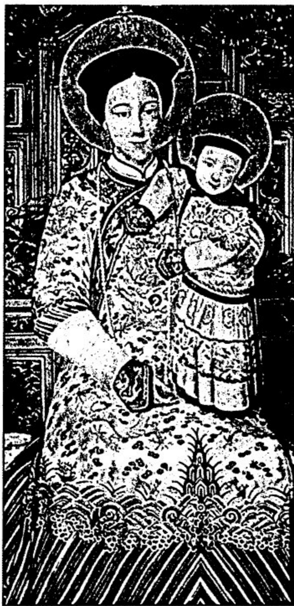
Икона Марии — Царицы КИТАЯ. XX в.

Численность католиков в К. неуклонно росла: от 250 тыс. чел. в 1840 до 3 млн. чел. в 1938. Быстро увеличивалось и количество организаций, посылавших миссионеров в различные области К. В 1842 франц. иезуиты расширили миссионер. деятельность в пров. Кианнан (совр. Киансу и Анхвей) и Чихли, с 1846 по 1859 к ним присоединились → лазаристы и исп. доминиканцы; в самых труднодоступных районах работали миссионеры Парижского