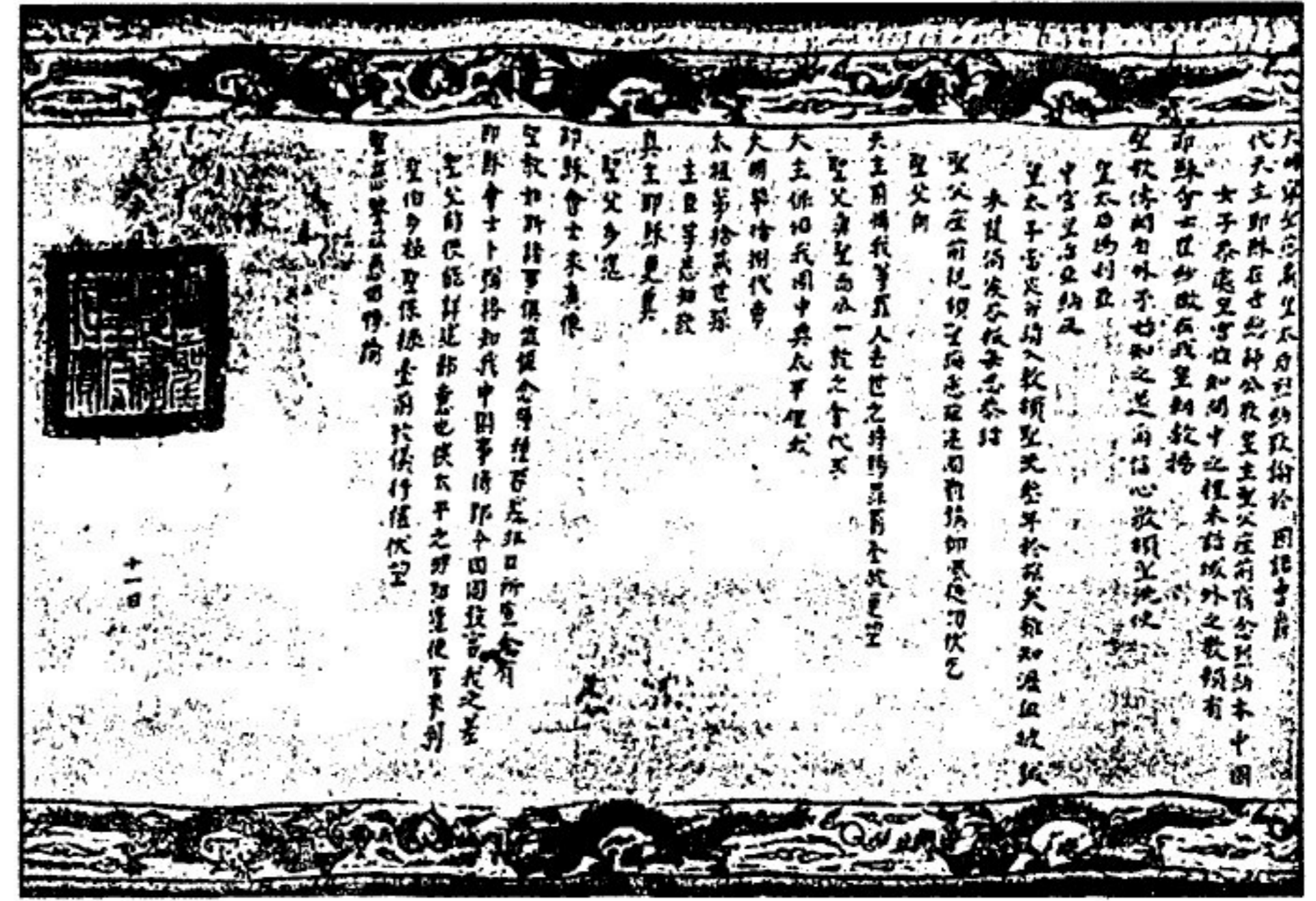
Письмо Папе Иннокентию X от китайской императрицы, принявшей в крещение имя Елена, с просьбой направить в КИТАЙ миссионеров-иезуитов. XVII в.

К. на неск. веков оказался закрыт для европейцев, пока в нач. XVI в. порт. корабли не достигли кит. и япон. берегов. Свящ.-иезуит → Франциск Ксаверий, известный своей миссионер. деятельностью в → Индии и → Японии, решил проповедовать христианство и в К., однако умер в 1552 от болезни на о-ве Шанчуаньдао в ожидании разрешения на въезд в страну. На протяжении последующих 30 лет миссионеры из числа → иезуитов, францисканцев, → доминиканцев и → августинцев тщетно пытались попасть в К. Единственным завоеванием европейцев в К. оставался порт Макао (совр. Аомынь), захваченный португальцами в 1557. Свящ.-иезуит А. Валиньяно, визитатор вост. миссий Об-ва Иисуса, утверждал, что для успешного выполнения миссии в К. миссионеры должны одеваться как китайцы, изучать кит. язык