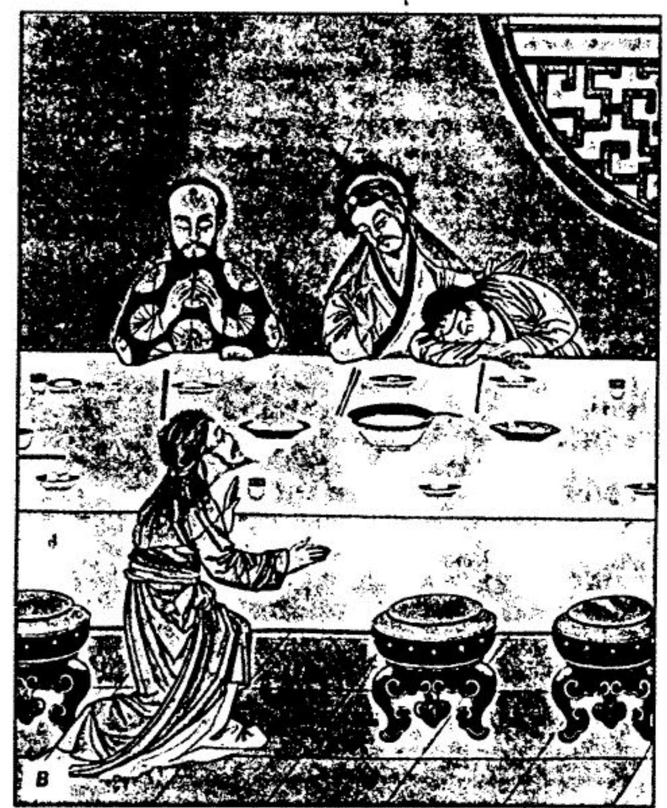
КИТАЙ: а) праздник Марии — Царицы Китая. 24 мая 1996. Донглу, пров. Хэбэй; б) богослужение в память салезианских мучеников в кафедральном соборе Гонконга; в) Вань Су Та. Тайная вечеря (фрагмент). XX в. Латеранский музей