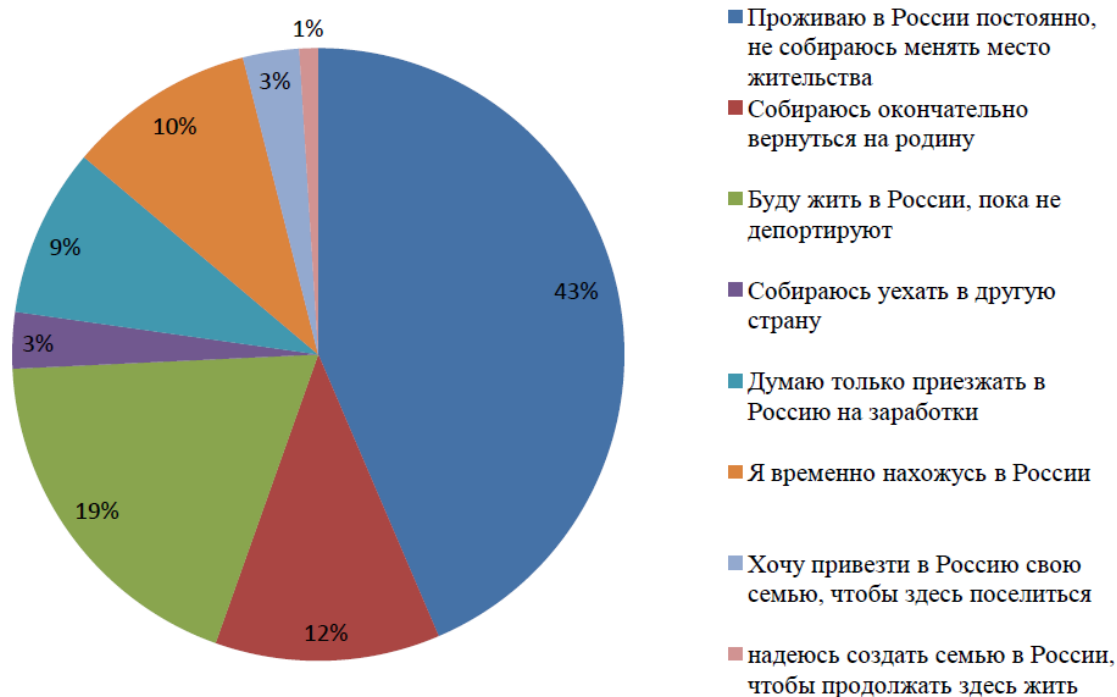
График № 6