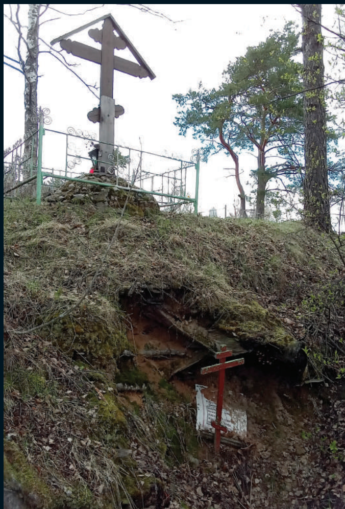
▲ Ил. 1. Пещерка в с. Худынское. 2022 г.