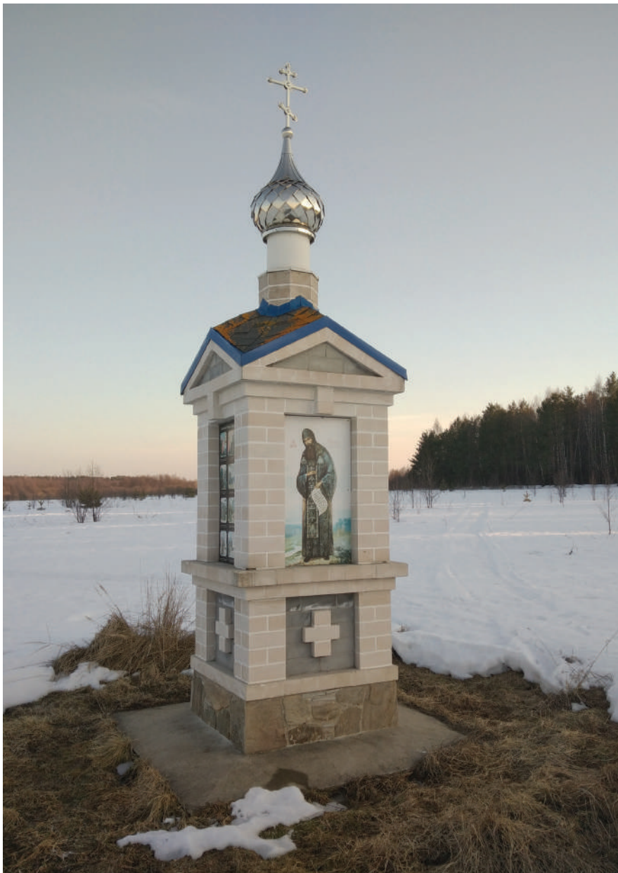
Часовня Тихона Лухского. 2022 г.