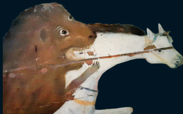
«Охота на льва». Фрагмент

■ Русский фольклор Республики Башкортостан