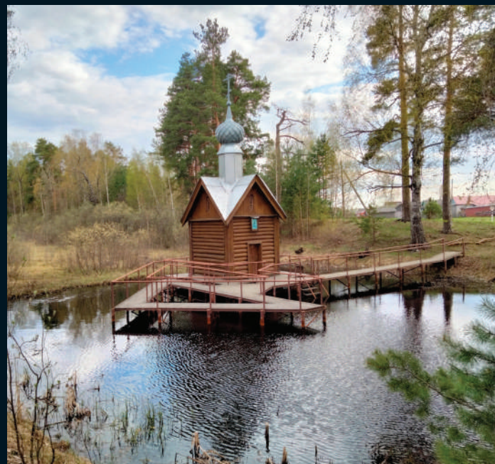
▲ Ил. 4. «Святой прудок» с часовней преподобного Тихона Лухского. 2022 г.

Статьи Л. В. Фадеевой и Д. В. Вахровского о почитании Тихона Лухского и Макария Желтоводского и Унженского читайте на с. 20–27.