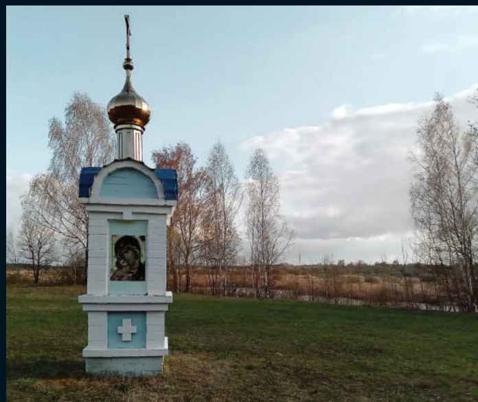
▲ Ил. 2. Часовня в Пустыньке. 2022 г.