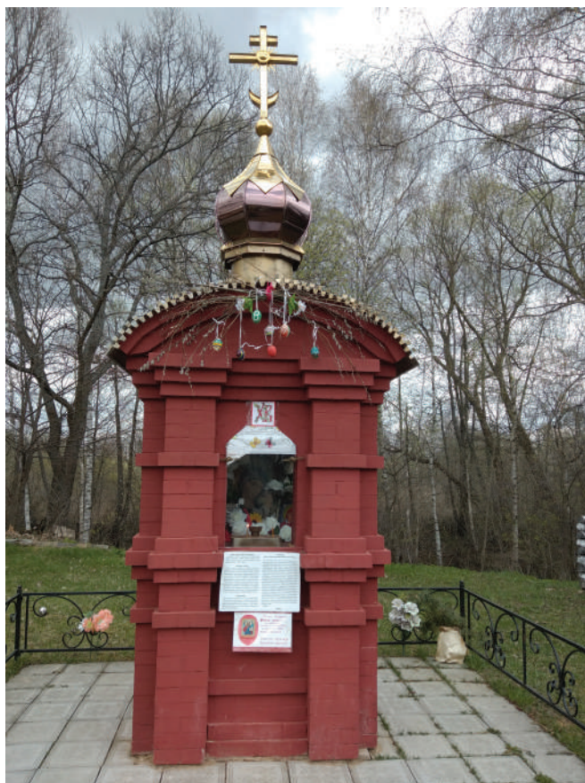
Казанская часовня, д. Бабино. 2022 г.