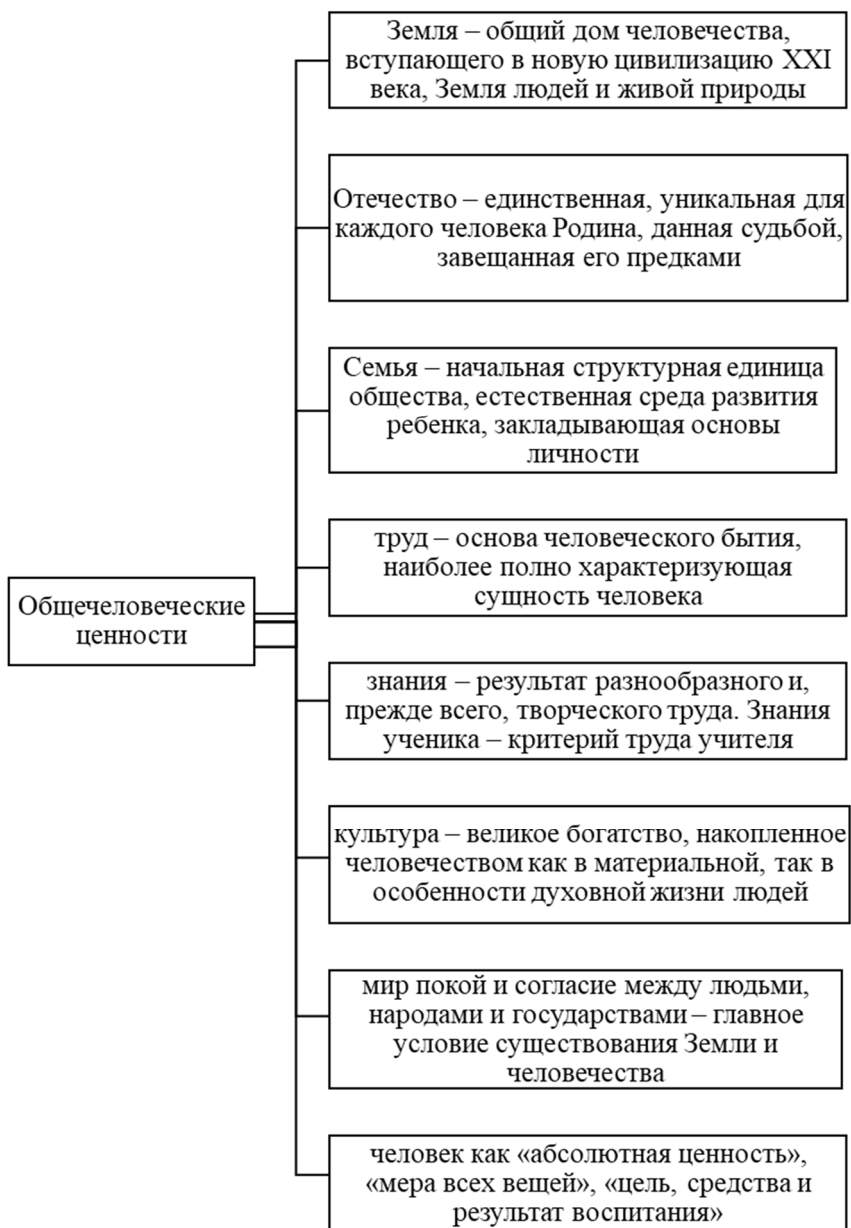
Рис. 4. Общечеловеческие духовно-нравственные ценности