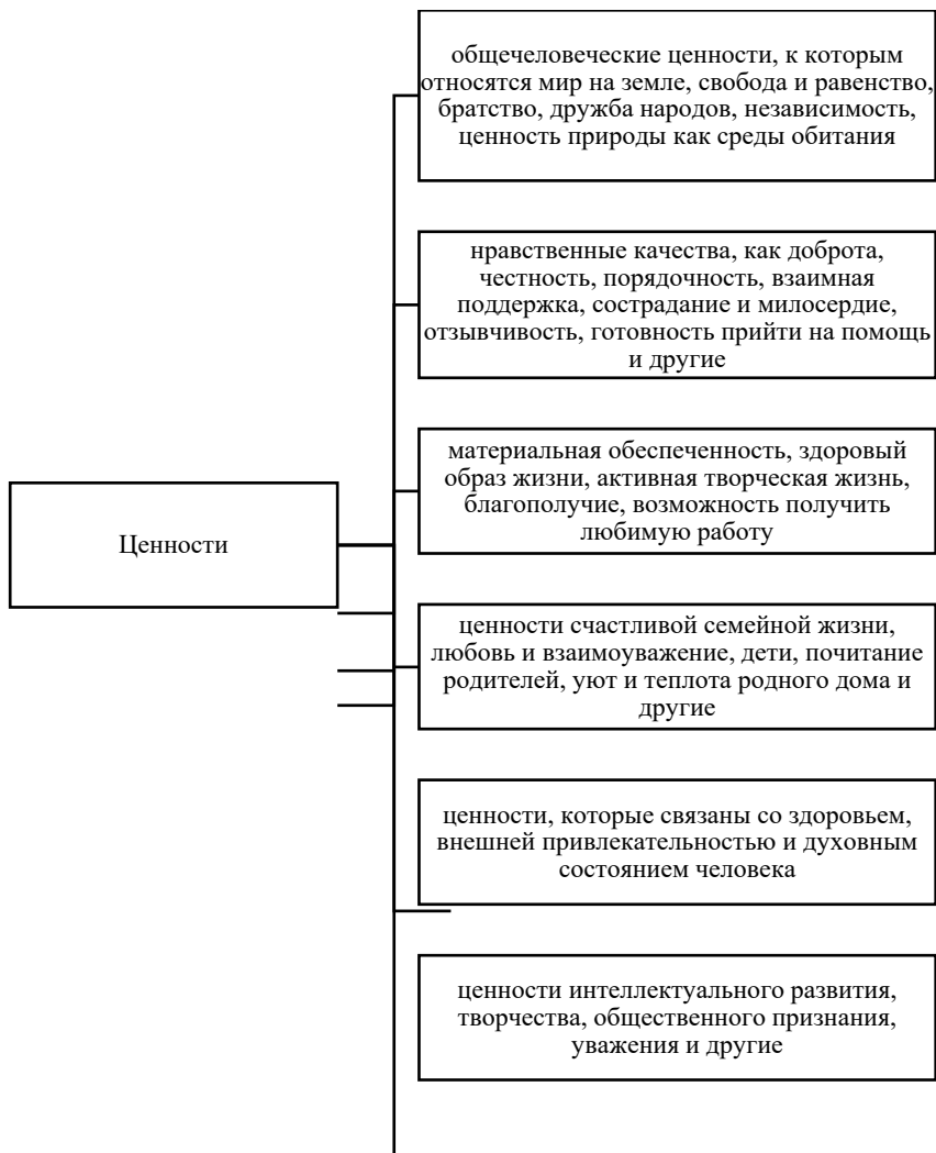
Рис. 3. Классификация ценностей по определению М.И. Шиловой

Понятия «добро – зло» обладают неизменно важным значением и могут варьироваться в зависимости от культурных и исторических контекстов, но при этом всегда отмечалось, что добро является духовно-нравственной категорией, ценностью, на основе которой необходимо строить свою жизнь, а зло – это безнравственная категория, которая не