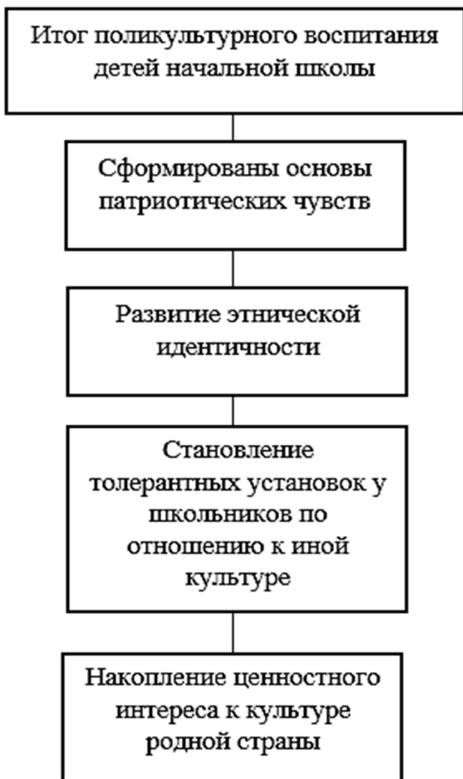
Рисунок 1 – Итоги поликультурного воспитания младших школьников