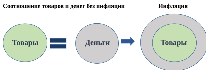
Рис. 1. Механизм возникновения инфляции в экономике

Задание 2. Напишите эссе на тему «Антиинфляционная политика в России». Обоснуйте необходимость антиинфляционной политики. Приведите три аргумента и два примера проведения антиинфляционной политики в России.