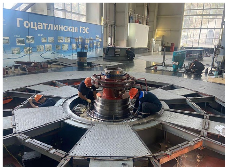
Гидроагрегат 1, Гоцатлинская ГЭС

Важным методическим принципом расчета является сальдирование результирующего эффекта по каждому показателю, т. е. его величина определяется в виде разницы получаемых выгод (выигрышей)