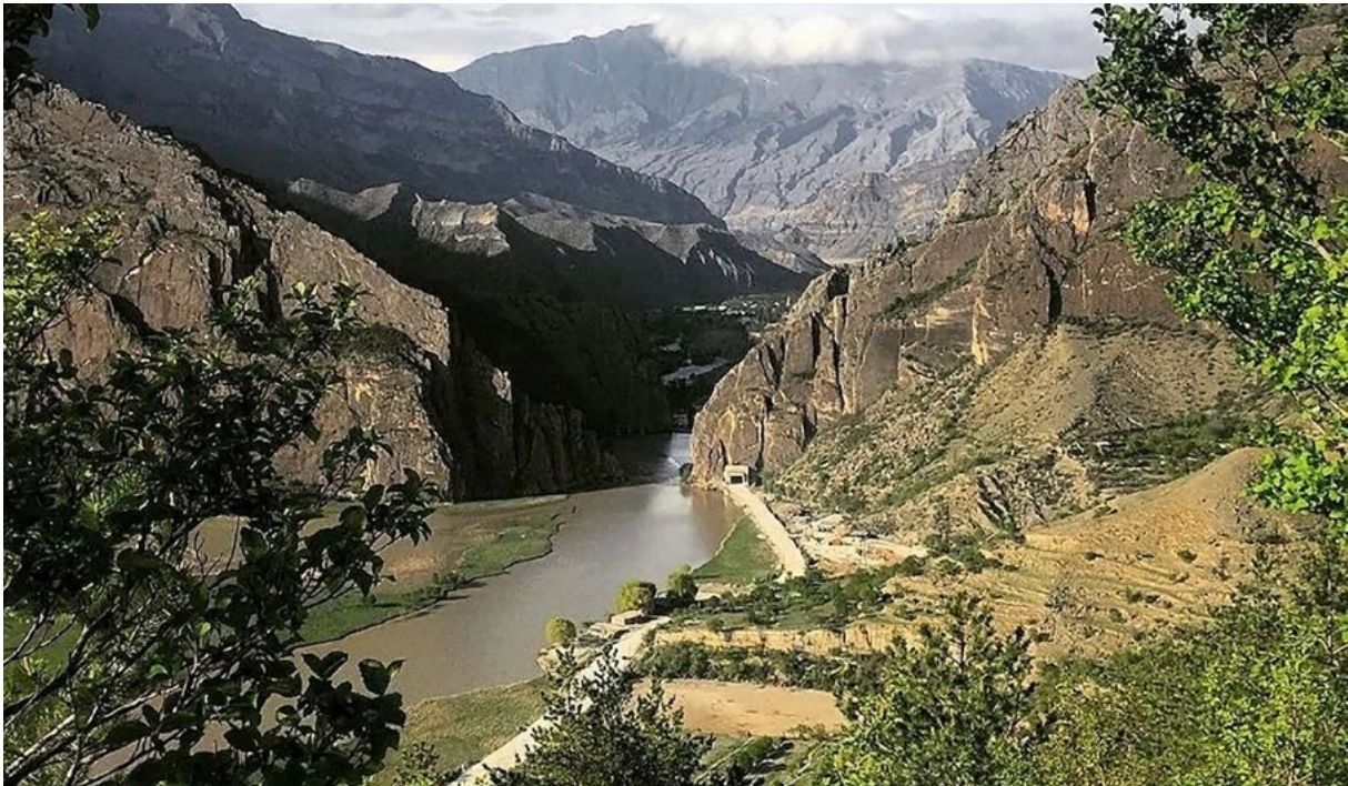
Водохранилище Гергебильской ГЭС

Кроме своей функции по замещению ископаемого органического топлива в энергобалансе, российские ГЭС являются еще уникальными поглотителями \text{CO}_2 и других парниковых газов, что позволяет дополнительно снижать углеродный след в экономике региона их размещения. Исследования, проведенные российскими