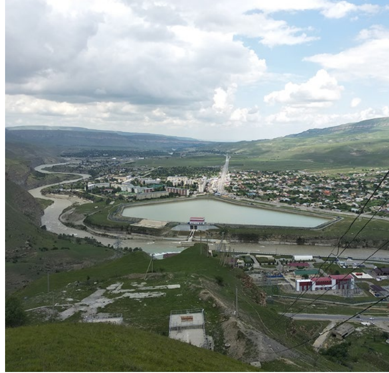
Зеленчукская ГЭС-ГАЭС

У России существует колоссальный неосвоенный гидропотенциал, особенно в Сибири и на Дальнем Востоке, и имеются уникальные возможности по его освоению на базе отечественных технологий