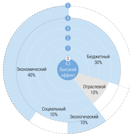
Рис. 2. Единый интегральный эффект для Селемджинской ГЭС

энергетики, обеспечивают стратегический запас пресной воды. Обеспеченность водными ресурсами оценивается на основании полезного 2 объема водохранилищ новых ГЭС.