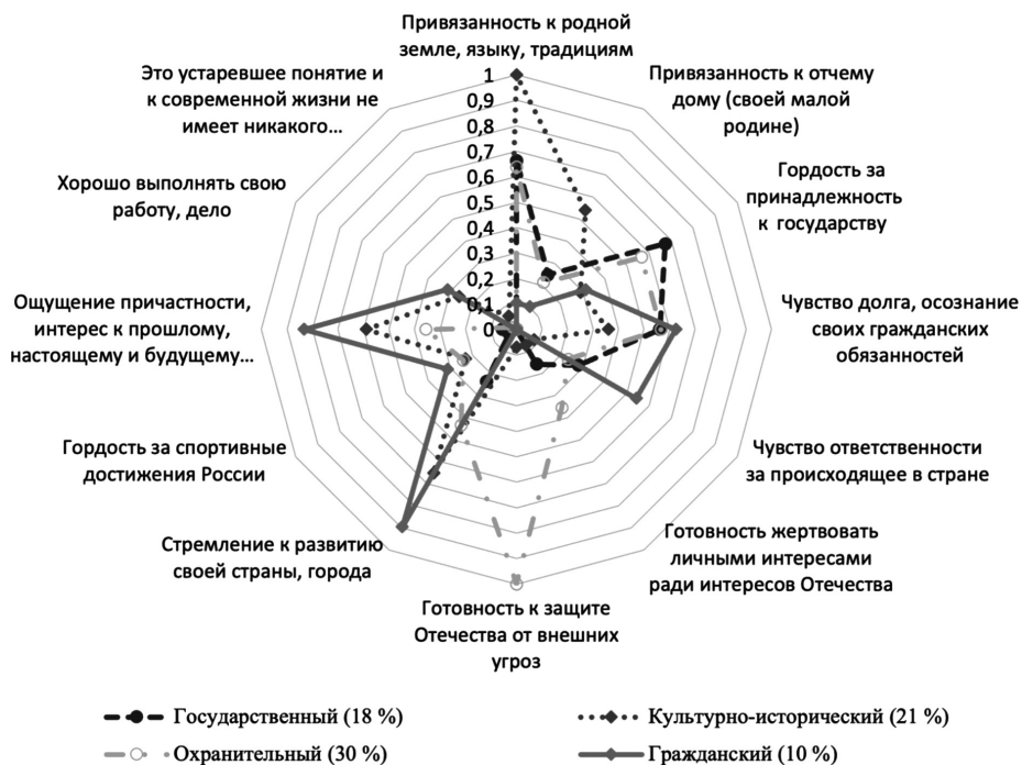
Рис. Кластеры и соответствующие им содержательные профили патриотизма (по результатам опроса 2023 г.)

наблюдаются минимальные показатели гражданственности и уровня гражданской активности (38 % не имеют опыта гражданского участия за последние два года).