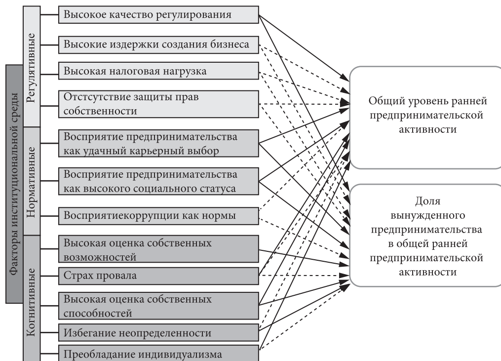
Рис. 2. Теоретическая модель исследования

Примечание: сплошной стрелкой отмечена положительная взаимосвязь, пунктирной — отрицательная.