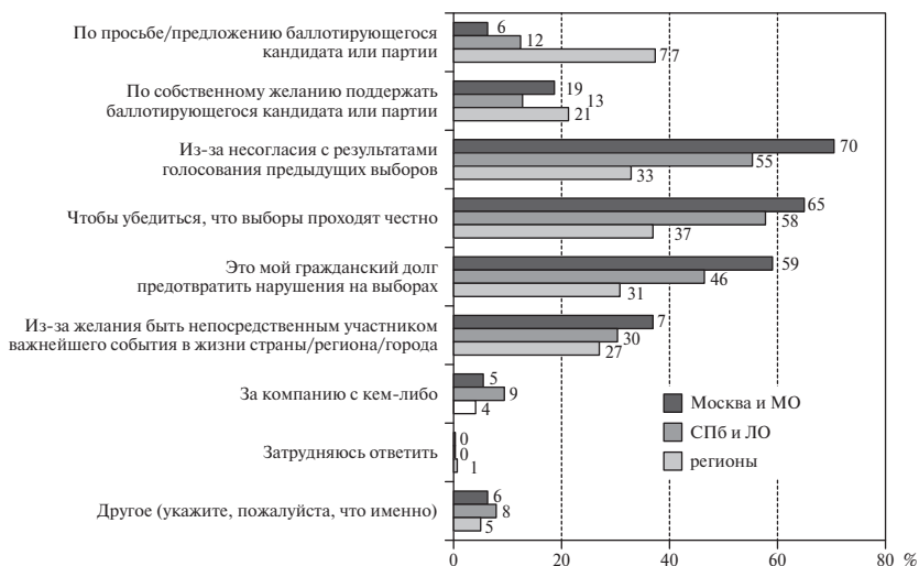
Рис. 3. Распределение ответов респондентов на вопрос: «Почему Вы впервые решили принять участие в выборах в качестве наблюдателя?», % от числа опрошенных

Несогласие с результатами голосования на предыдущих выборах (59% по выборке в целом) во всех регионах проведения опроса является одной из самых главных причин мобилизации большого числа граждан к участию в наблюдении. Видео, снятые во время голосования в Государственную Думу в декабре 2011 г. и выложенные в сеть Интернет, для многих стали неоспоримым свидетельством нарушений, повлиявших на результат голосования. Протестная активность, развившаяся именно по причине несогласия с результатами голосования на выборах в Государственную Думу, стала важным проводником к деятельности по наблюдению на выборах. Желание убедиться, что выборы проходят честно, и желание предотвратить нарушение закона (57 и 50% по выборке в целом) также объединяют российские регионы и столицы в мотивации впервые принять участие в деятельности по наблюдению на выборах. Соответствующая мотивация актуализируют запрос на личное участие гражданина в выборном процессе, желание на собственном опыте проверить качество выборов. Также крайне низка доля тех, кто за компанию с кем-либо (5% по выборке) решил впервые принять участие в деятельности по наблюдению на выборах как в российских регионах, так и в столицах.