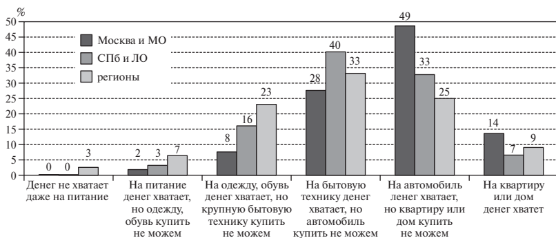
Рис. 1. Распределение ответов респондентов на вопрос: «Какое высказывание точнее всего описывает материальное положение Вашей семьи?», % от числа опрошенных

портрета, которые в той или иной мере сходны среди наблюдателей всех регионов, где проводился опрос, относятся: средний возраст (18–45 лет) (79%), высшее образование (71%), значительная доля занятых в сфере информационных технологий/связи/Интернета и образования (18 и 8% по всей выборке соответственно). Отличительные черты наблюдателей на выборах в российских регионах и столицах проявляются в уровне доходов, самоидентификации с каким-либо классом и сфере занятости. Так, наблюдатели из г. Москвы декларируют значимо более высокое материальное положение — 49% наблюдателей-москвичей может позволить купить себе автомобиль, в то время как в г. Санкт-Петербурге таковых лишь 33%, а в регионах 25% (рис. 1).