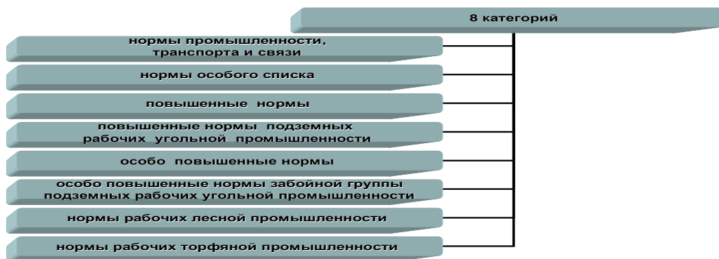
Рис. 3. Категории норм продовольственного снабжения рабочих

Однако нормы хлебного снабжения служащих также не были чем-то застывшим и неизменным. Так, с начала карточной системы до 21 ноября 1943 г. служащие обеспечивались хлебом по двум категориям – по 1-й – 500 г в день и по 2-й – 400 г. В соответствии с постановлением СНК СССР от 15 ноября 1943 г. за № 1263-379-с все служащие стали обеспечиваться хлебом по единой норме – 400 г в день. При этом для служащих ведущих отраслей промышленности с 21 ноября 1943 г. были установлены более высокие нормы снабжения хлебом: для служащих угольной, оборонной промышленности и металлургии, железнодорожного и водного транспорта - 450 г в день, а служащим черной металлургии - 500 г. Служащие в Москве обеспечивались хлебом по норме 450 г в день, а в Ленинграде и районах Крайнего Севера – 500 г.