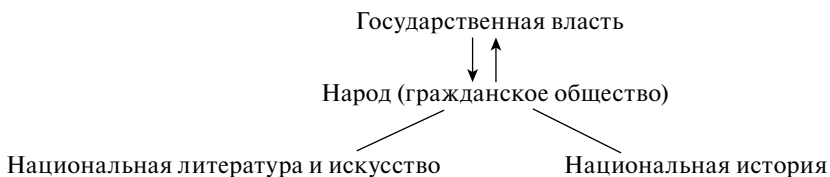
Рис. 2. «Договорная» идеальная модель организации государственной власти в национальных государствах современной Европы

русский авторитаризм XVIII–XIX вв., но в длительной перспективе авторитаризм в Европе неустойчив и существует на фоне действующих судов и права, искажая, но не отменяя последних. То же можно сказать про фашизм – в Европе фашизм в длительной перспективе неустойчив. Режимы Гитлера и Сталина часто не без оснований сравнивают, но при Гитлере многие правовые и экономические «договорные» институты сохранялись (в этом плане показательна история работы и жизни Н.В. Тимофеева-Ресовского в гитлеровской Германии), а при Сталине – нет.