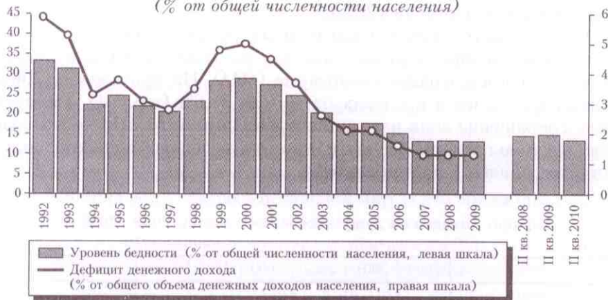
Уровень бедности в России, 1992—2009 гг. (% от общей численности населения)