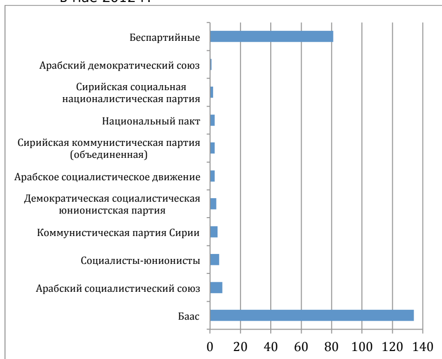
Рис. 1. Результаты выборов в Народный совет Сирии в мае 2012 г.

сирийского населения (Рис. 3) попросту во многом «съедали» ВВП и тормозили экономическое развитие.