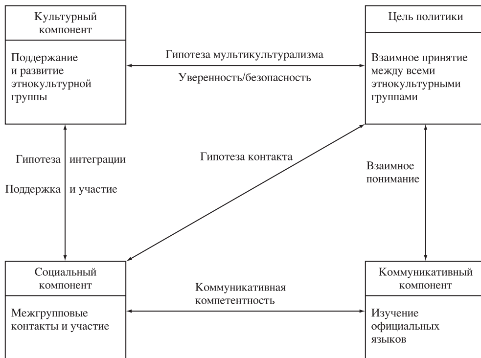
Рис. 1. Компоненты мультикультурной политики Канады и связи между ними [10].

нокультурных групп друг друга (верхний правый компонент на рис. 1). Эта цель достигается через три других важных компонента. Слева сверху – культурный компонент политики, который реализуется через оказание поддержки и поощрение сохранения культуры и развития всех этнокультурных групп. Второй компонент – социальный, или межкультурный (слева внизу), он характеризует возможность позитивного взаимодействия представителей различных этнических групп путем обеспечения межгруппового контакта и снятия барьеров, препятствующих равноправному участию в повседневной жизни общества. Последний элемент – межкультурная коммуникация (правый нижний угол на рис. 1). Этот компонент указывает на необходимость наличия общего, официального языка, чтобы представители всех этнических групп могли быть включены в повседневную жизнь общества.