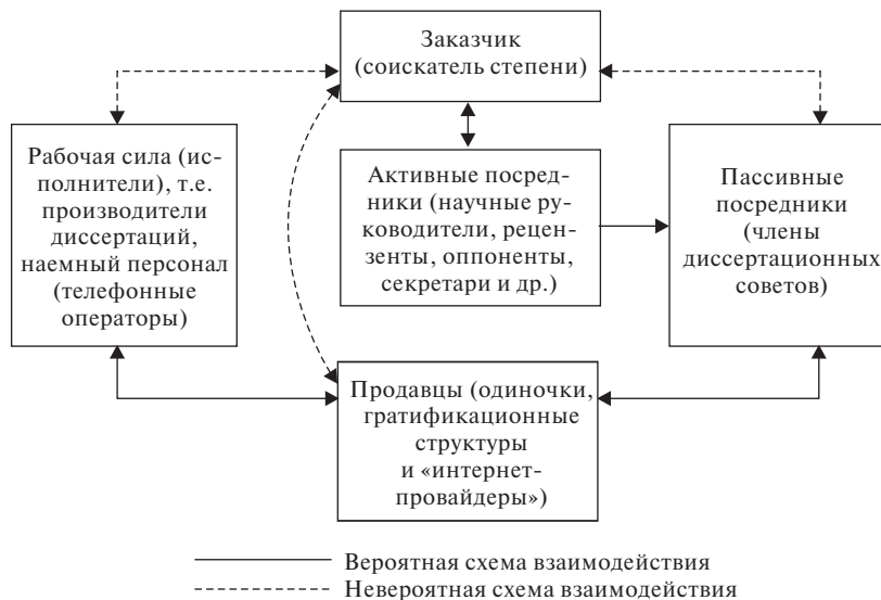
Рис. 2. Схема взаимодействия на рынке диссертационных услуг

нах распространяется обычно через Интернет и рассылки по электронной почте 47 . Отношения между клиентами и организацией регулируются на контрактной основе: в формальных договорах оговариваются сроки, цены и прочие условия выполнения соглашений. Безусловно, многие из этих организаций в сильной степени пересекаются с организациями первого типа (хотя в действительности являются их конкурентами) — например, через одних и тех же посредников, которые обеспечивают гарантированную защиту диссертаций и прохождение всех этапов экспертизы (включая экспертизу ВАК). При этом минимизация рисков (предотвращение провала во время защиты) более эффективна для первого типа организаций благодаря задействованным в них более сильным социальным связям.