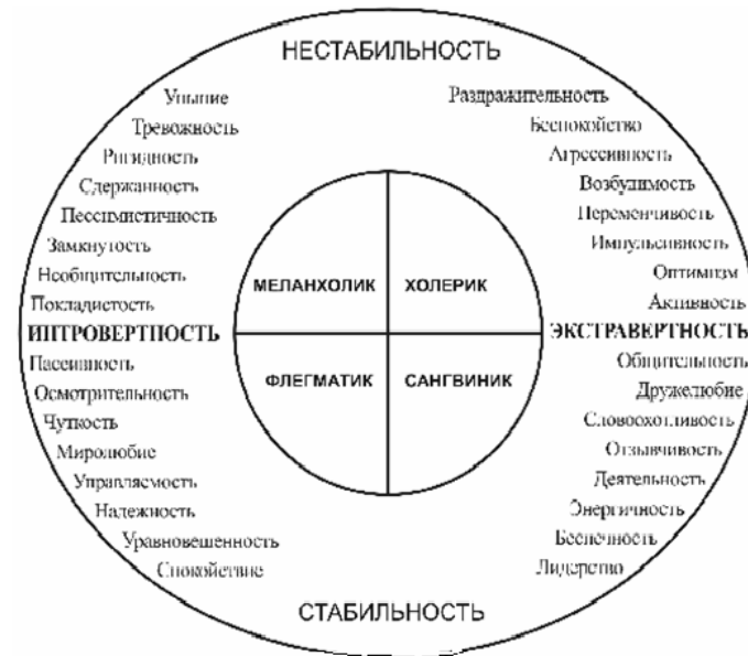
Рис. 1. Психологические типы (по Г. Айзенку)

темперамента (рис. 1). Меланхолик – это нестабильный интроверт, холерик – нестабильный экстраверт, флегматик – стабильный интроверт, а сангвиник – стабильный экстраверт.