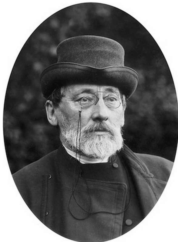
Константин Николаевич Леонтьев (1831–1891)

4 Кантор В.К. Константин Леонтьев: христианство без надежды, или Трагическое чувство бытия // Кантор В. "Крушение кумиров", или Одоление соблазнов М., 2011. С. 111.