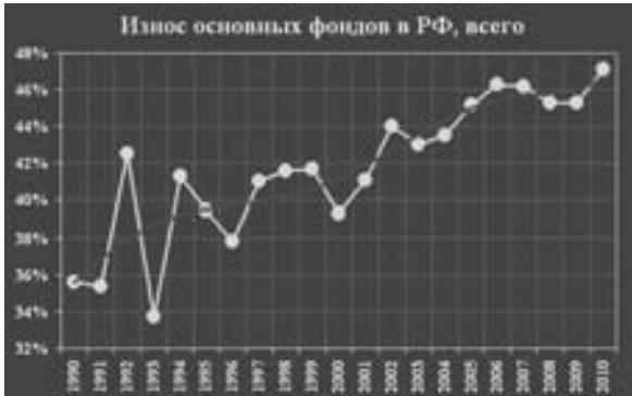
График 5. Износ основных фондов в РФ в целом и полиномиальная линия тренда