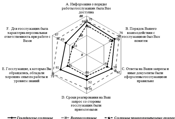
Рис. 3. Субиндекс оправданных ожиданий

Значения целого ряда показателей субиндекса оправданных ожиданий, основанных на оценках личного опыта взаимодействия опрошенных с гражданскими служащими, находятся в интервале «выше среднего» (рис. 3).