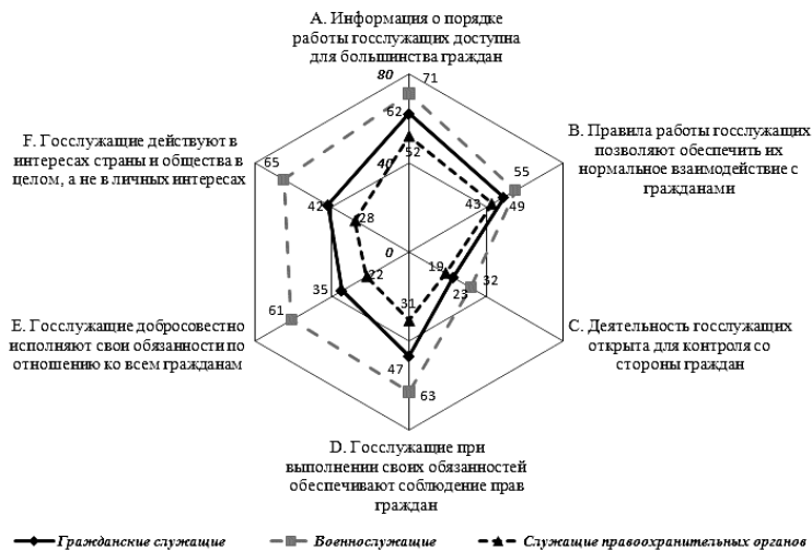
Рис. 2. Субиндекс структурных условий

Анализ значений показателей субиндекса структурных условий деятельности гражданских служащих (рис. 2) свидетельствует, что наиболее низко респондентами оценивается такой аспект деятельности гражданских служащих, как открытость для контроля со стороны граждан. Однако для сбалансированного функционирования аппарата государственной власти гражданское общество должно располагать инструментами контроля за профессиональной служебной деятельностью государственных служащих.