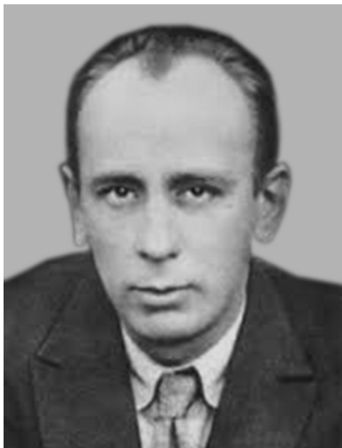
Михаил Михайлович Бахтин Вторая половина 1920-х годов