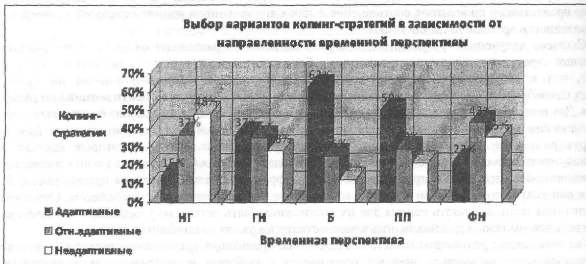
Рис. 2. Выбор вариантов копинг-стратегий в зависимости от направленности временной перспективы

Ориентация личности на позитивное прошлое значимо коррелирует с выбором адаптивных вариантов эмоциональных и поведенческих стратегий (коэффициент корреляции Пирсона r=0,321 и r=0,298 при уровне значимости p<0,05 и p<0,01 соответственно). Как уже было сказано выше, в размышлениях личности о своем позитивном прошлом присутствуют множество ностальгических моментов, положительных ярких эмоциональных переживаний. Следовательно, столкнувшись с конфликтной ситуацией, человек старается сохранить оптимизм и веру в собственные силы справиться с конфликтом и так же, как это было раньше, извлечь для себя полезный опыт. Важным ресурсом совладания с конфликтом рассматривается сотрудничество и взаимодействие с другими людьми.