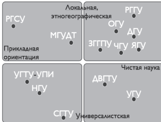
Рис 2. Ориентации российских университетских программ по социальной антропологии

Первая ось — это установка на универсалистский формат представления материала или же на локальную, этногеографическую традицию. Вторая ось расположена между полюсами «чистая наука» (прикладные аспекты явно не представлены) и «прикладная ориентация» (в названиях дисциплин учебного плана сделан акцент на применимости знания вне академии — «Менеджмент», «Анимационные технологии», «Социальное проектирование»). Схема эта, конечно, условная, и понятно, что те или иные ориентации не наполняют учебные планы на 100 %, а проявляются в разной степени, хотя в некоторых вузах составляют ядро образовательной программы: «Я вижу абсолютное применение социального антрополога в политической сфере прежде всего. Вот тот правовой беспредел, коррупция, намеренное создание конфликта, вот что меня просто, просто как человека беспокоит. В том числе, или даже в первую очередь этнические конфликты <...> То есть, я вот в этом вижу исключительно политический момент» (Интервью 5).