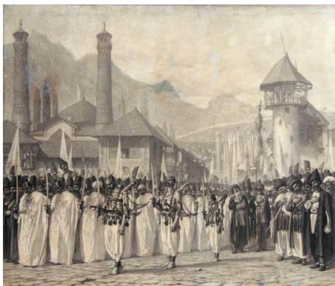
Рис. 2. В. В. Верещагин. Религиозная процессия на празднике Мохаррем в Шуше, 1865 г. (Государственная Третьяковская галерея).

ный в битве при Кербела в 680 году; его гибель шииты, одно из двух крупнейших направлений мусульманства, оплакивают уже не менее тринадцати столетий... Все больше крови обгаляло пыльные камни, все большее исступление овладевало процессией. И потом <...> не сюда ли она повернула, не здесь ли запылали костры, на которых кипели котлы с мясом жертвенных баранов» [1, с. 174–176; 2, с. 53–55]. Очень живая сценка! Как будто рассматриваешь раскрашенные ориенталистские почтовые карточки по Кавказу начала XX в. или В. В. Верещагина, читаешь путевые заметки художника, посетившего Шушу в 1865 г. и не менее Шумовского пораженного траурными процессиями шиитов на 'Ашуру (рис. 2). Не исключено, что, подобно В. В. Верещагину, автор воспоминаний не мог удержаться от соблазна поразить читателя экзотикой мусульманского Востока России.