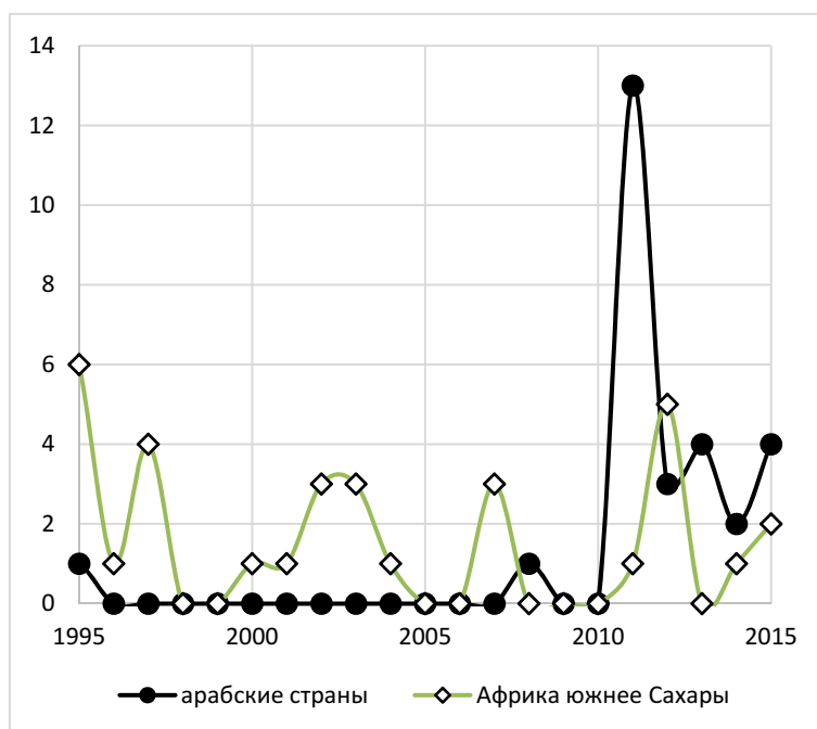
Рис. 4. Динамика общего числа политических забастовок, зафиксированных базой данных CNTS в странах Африки южнее Сахары и арабском мире в 1995–2015 гг.

шлись также на сектор здравоохранения: врачи и прочий медицинский персонал требовали повышения заработной платы и улучшения условий труда. Тысячи бастующих работников были уволены (The Guardian 2012; BBC News 2013).