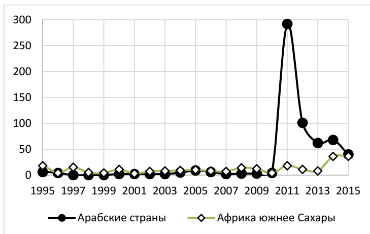
Рис. 2. Динамика общего числа крупных антиправительственных демонстраций, зафиксированных базой данных CNTS в странах Африки южнее Сахары и арабском мире в 1995–2015 гг.

Рост общего числа антиправительственных демонстраций в Африке южнее Сахары в 2011–2015 гг. был не особо сильным по сравнению с большинством других мир-системных макрорезонансов, но по меркам самой этой макрорезонансы был очень заметным, и локальный исторический рекорд по этому показателю Африка в 2014 г. все-таки побила (см. Рис. 2).