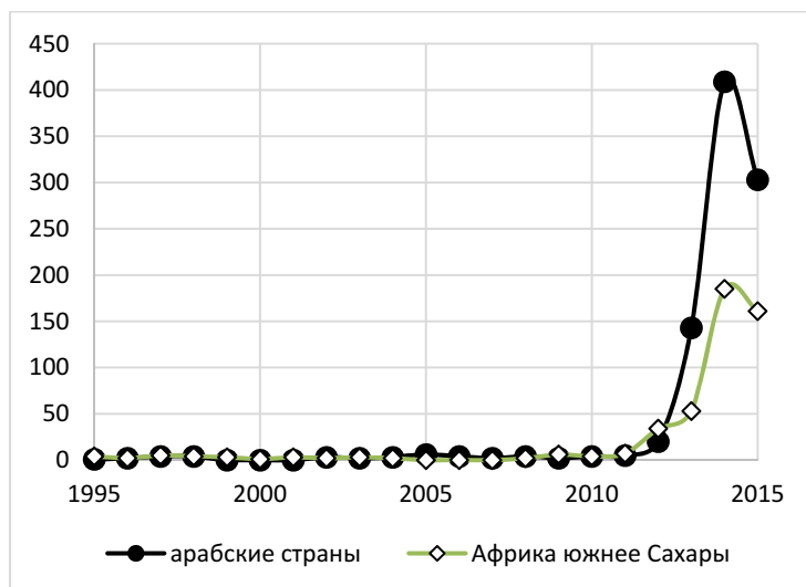
Рис. 5. Динамика общего числа крупных террористических актов / «партизанских действий», зафиксированных базой данных CNTS в странах Африки южнее Сахары и арабском мире в 1995–2015 гг.

сти развернувшиеся по трагическому сценарию события в Ливии и дальнейший фактический распад этого североафриканского государства, вызванный военно-политическим конфликтом. Многие военные склады после падения режима М. Каддафи были разграблены, что открыло легкий доступ к ливийскому оружию членам вооруженных террористических, криминальных организаций.