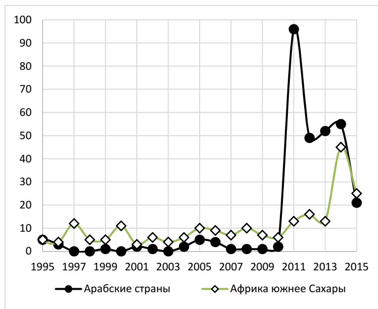
Рис. 3. Динамика общего числа крупных массовых беспорядков, зафиксированных базой данных CNTS в странах Африки южнее Сахары и арабском мире в 1995–2015 гг.

Очень похожая картина в 2011–2015 гг. наблюдалась в Африке южнее Сахары и применительно к массовым беспорядкам; впрочем, рост их числа здесь в эти годы был заметно более выразительным (см. Рис. 3).