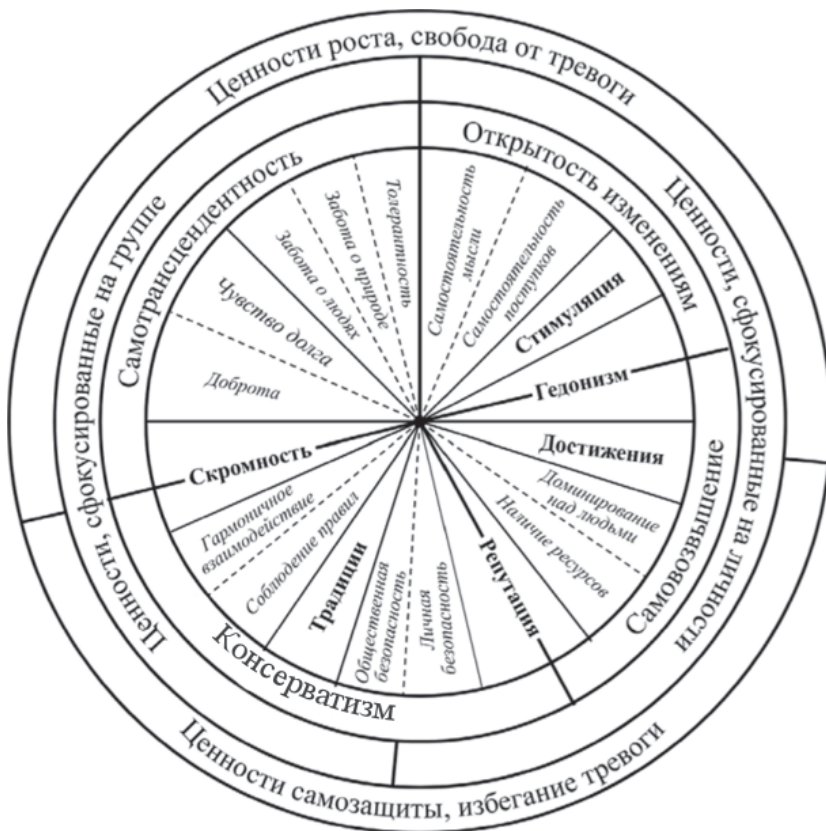
Рис. 1. Континуум индивидуальных ценностей, согласно обновленной теории Ш. Шварца

логический. Таким образом, данный предиктор проявляется в виде разных психологических процессов — эмоций, чувств, установок и убеждений, а также в виде физиологических реакций. Как правило, большинство исследований сфокусировано на изучении аффективного компонента [34]. Межгрупповая тревожность может играть роль медиатора между такими предпосылками, как личностные черты, установки, персональный опыт и ситуационные факторы, и всеми видами последствий: когнитивными, эмоциональными и поведенческими [34; 41]. Если говорить о поведенческих