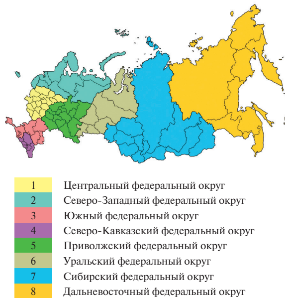
Рис. 1.1. Федеральные округа России

На территории России изначально было выделено семь федеральных округов. При этом их границы не нарушают сложившееся административно-территориальное деление государства, не меняют границы ее регионов (субъектов Федерации). В 2010 году был образован восьмой федеральный округ — Северо-Кавказский, выделенный из состава Южного федерального округа указом Президента России от 19.01.2010 № 82. В 2014 году после вхождения Автономной Республики Крым в состав Российской Федерации (на основании проведенного на его территории референдума), в соответствии с указом Президента России от 21.03.2014 № 168, был образован Крымский федеральный округ, который указом Президента РФ от 28.06.2016 № 375 был упразднен, а входившие в него субъекты Федерации — Республика Крым и город федерального значения Севастополь включены в состав Южного федерального округа.