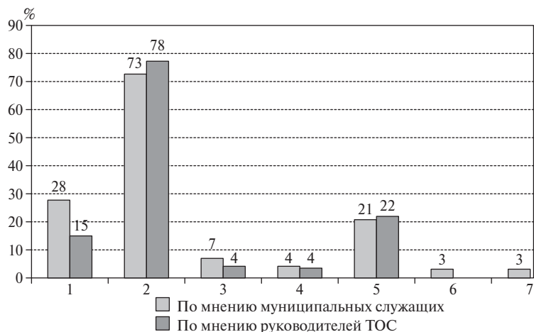
Рис. 1. Распределение ответов респондентов на вопрос: «Что, на Ваш взгляд, подтолкнуло жителей вашей территории самоорганизоваться в ТОС», % опрошенных, допускаясь выбор любого числа вариантов ответа:

По результатам анкетного опроса респондентов (рис. 1) 73% опрошенных из числа муниципальных служащих и 78% руководителей ТОС ответили, что основным фактором, подтолкнувшим жителей города к созданию сообщества, стало желание получить финансирование от органов власти на благоустройство жилого дома или прилегающей к нему территории (ремонт общего имущества, озеленение территории, строительство детских площадок и обустройство других мест общего пользования). Примечательно, что данный вариант ответа выбрали большинство респондентов, стороны как со-