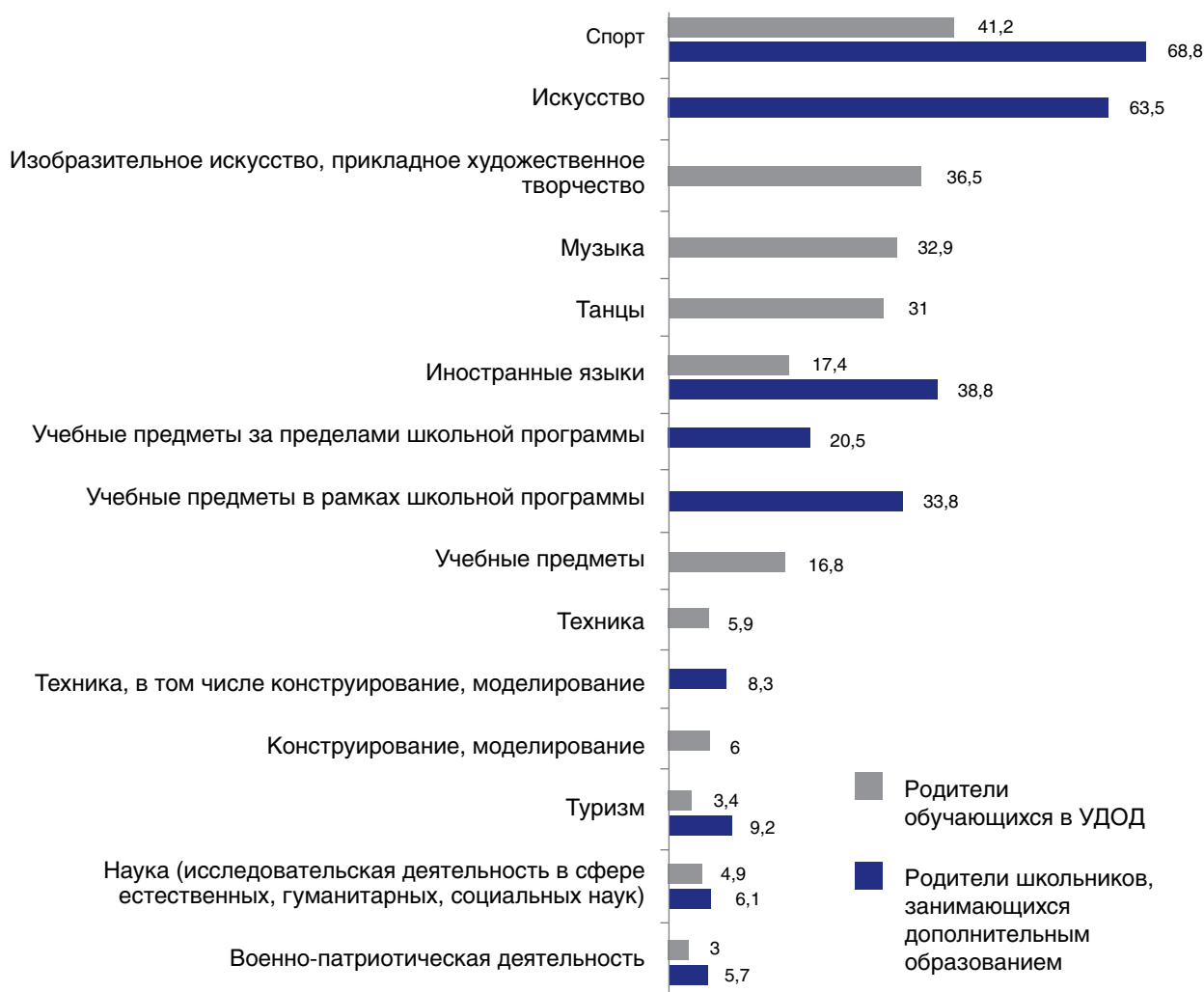
Рис. 4. Наиболее распространенные программы дополнительного образования детей, по опросу их родителей, %

степени разнообразны – перечень видов спорта и видов искусства действительно широк; так, в сфере искусства танцами занимаются 31% детей, музыкой – 32,9%, изобразительным и декоративно-прикладным искусством – 36,5%.