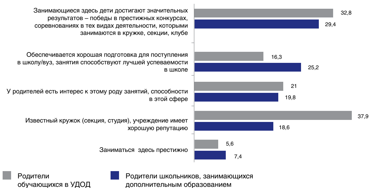
Рис. 6. Образовательные запросы родителей в сфере дополнительного образования, %

образа жизни. Примечателен запрос родителей на известность кружка (секции, студии), на хорошую репутацию учреждения. Данный запрос в значительно большей степени (37,9 и 18,6%) касается учреждений дополнительного образования (рис. 6).