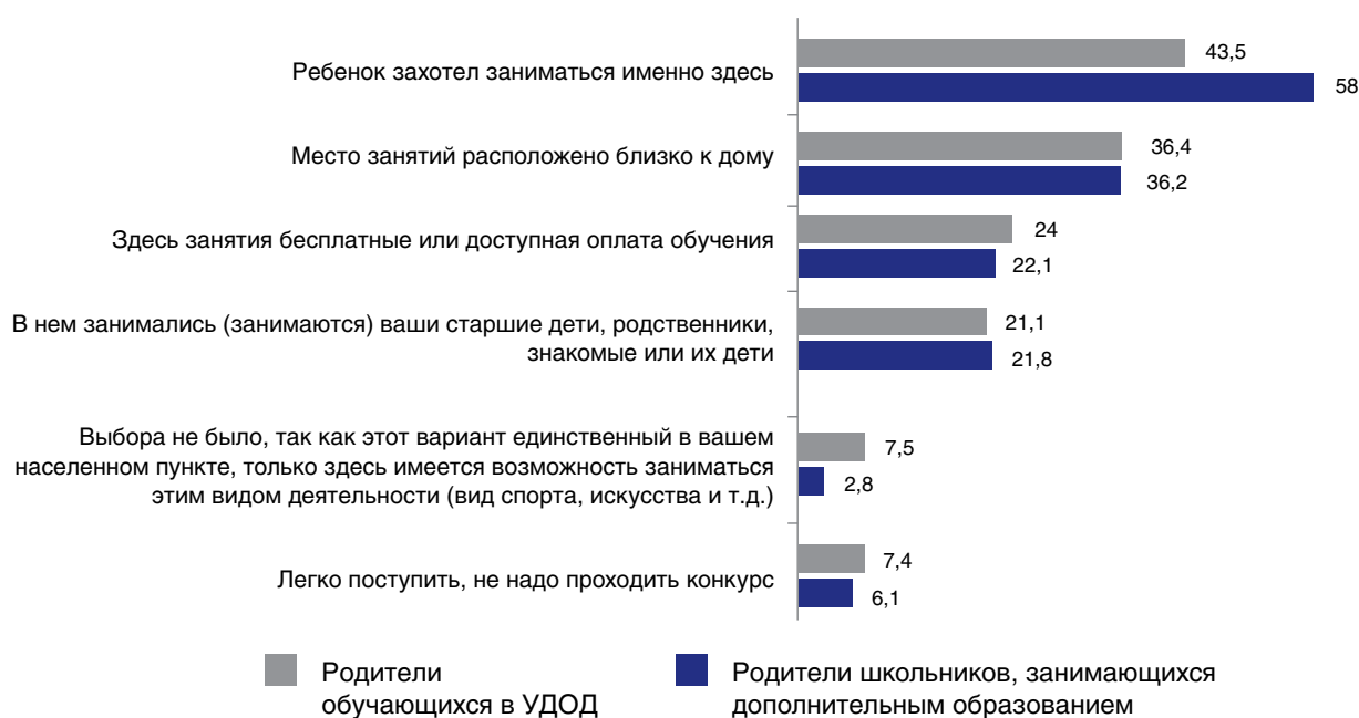
Рис. 5. Социальные причины выбора программы дополнительного образования, детей, по опросу их родителей, %

а признанием самостоятельности своего ребенка.