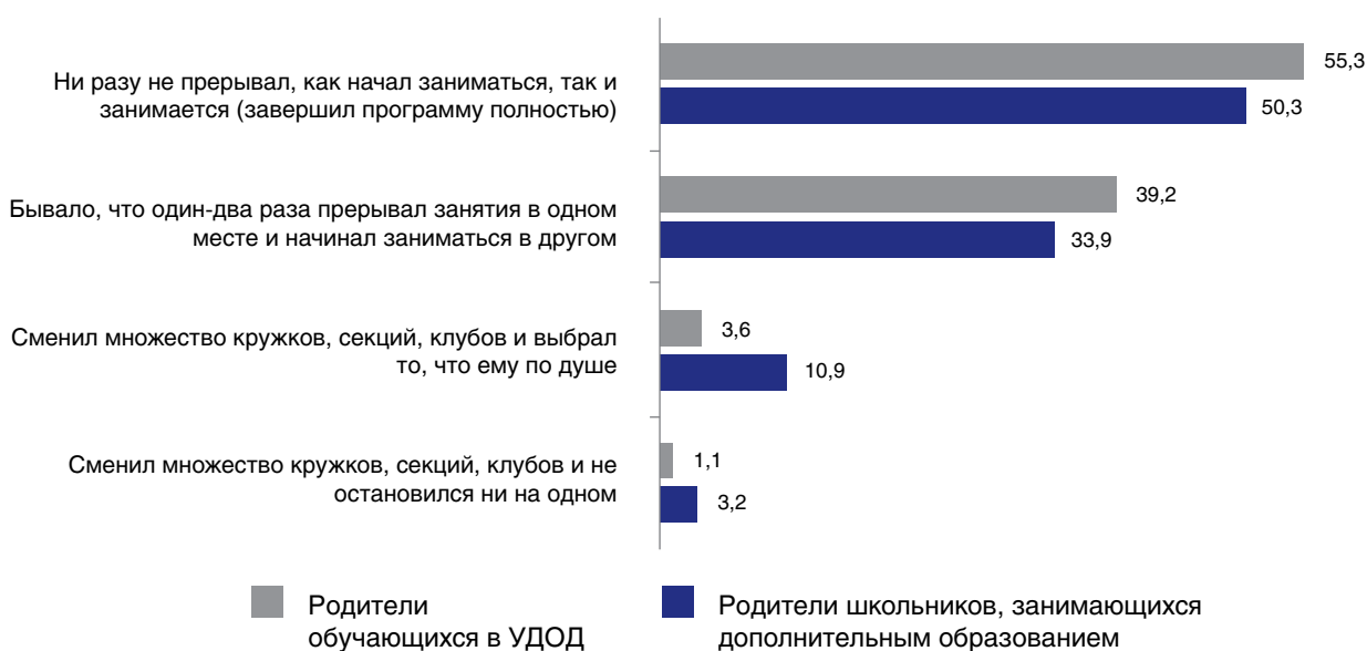
Рис. 3. Индивидуальные образовательные траектории детей, по опросу их родителей, %

заниматься в другом (в других) (так ответили соответственно 39,2 и 39,9% родителей);