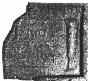
Рис. 16. Мерное клеймо агоранома, Нимфей (по: Sarykin 2020a)