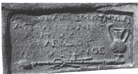
Рис. 18. Мерное клеймо агоранома, Мирмекий, загородная усадьба (по: Sarykin 2020a)

(начинающихся на \text{V}\iota\sim названий полисов на Боспоре нет). Вообще же в эллинской топонимике существуют только два примера топонимов, начинающихся на \text{V}\iota\sim 16 : локализуемая на территории современной Болгарии \text{V}\iota\zeta\acute{\omega}\nu\eta 17 и \text{V}\iota\sigma\acute{\alpha}\nu\theta\eta на фракийском берегу Пропонтиды 18 .