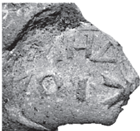
Рис. 20. Не мерное клеймо Демиона, тип «шестилучевая звезда» (по: Fedoseev 2016)