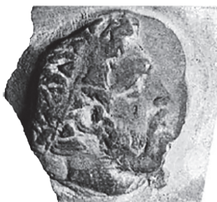
Рис. 9. Мерное клеймо, монетный тип «правитель в диадеме» (по: Fedoseev 2016)