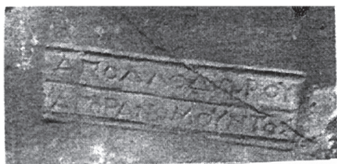
Рис. 14. Мерное клеймо агоранома, Гермонасса (по: Sarykin 2020a)