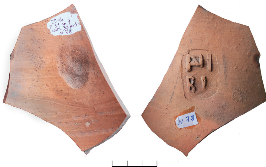
Рис. 1. Мерное клеймо (Βι-) на ойнохое из раскопок Елизаветовского городища в 2016 году (по: Kovalenko 2021)

Основной задачей в 2016 г. было уточнение конструктивных особенностей выявленных ранее объектов строительной и хозяйственной деятельности жителей Большой греческой колонии. С этой целью были проведены масштабные мероприятия, направленные на ликвидацию разрушений и сохранение границ раскопа для дальнейшего его научного изучения. Исследования на данном участке проводились преимущественно в северо-западной части раскопа в пределах уже существующих границ площадей 3–5. Общая площадь участка составила 278 м 2 . В северо-западной части раскопа было продолжено детальное изучение культурных напластований и археологических объектов, прежде всего выявленных ранее строительных комплексов 31 и 32. Для уточнения северной границы строительного комплекса 32 к северу от площади 3 была заложена новая площадь 6. В 2016 г. исследования осуществлялись с уровня горизонтов, зафиксированных в прошлом сезоне. Была проведена их тонкая зачистка и точнее определены границы