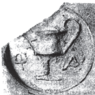
Рис. 6. Мерное клеймо, тип канфар + ΦΑ (по: Sarykin 2020a)