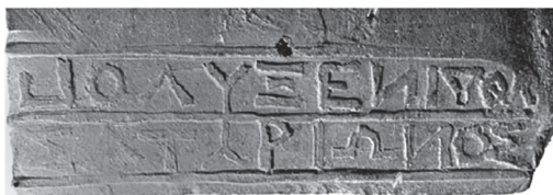
Рис. 15. Мерное клеймо агоранома, Китей (по: Fedoseev 2016)