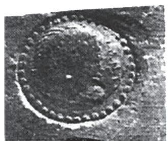
Рис. 5. Мерное клеймо с легендой ΠΑΝΤΙ (по: Koval'chuk 2012)