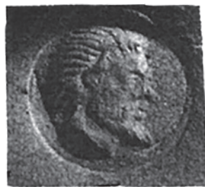
Рис. 10. Мерное клеймо, «говорящий» монетный тип: сатир (по: Koval'chuk 2012)