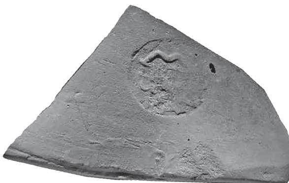
Рис. 4. Мерное клеймо с легендой ΠΑΝ (по: Fedoseev 2016)