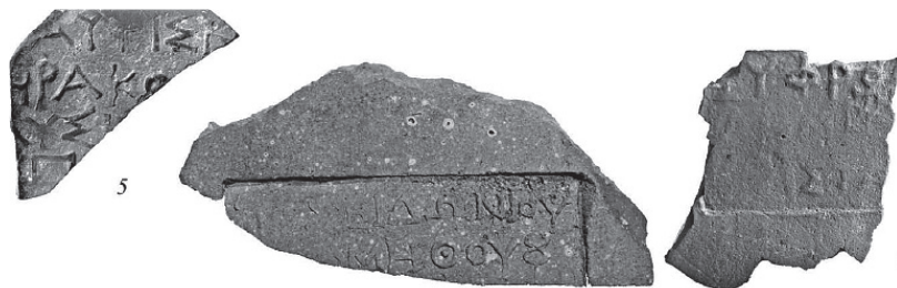
Рис. 19. Предположительно магистратские мерные клейма Боспора (по: Fedoseev 2016)