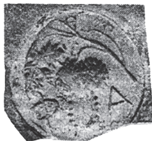
Рис. 7. Мерное клеймо, тип гроздь + ΦΑ (по: Sarykin 2020a)

Публикуемый фрагмент неправильной пятиугольной формы имеет следующие размеры: высота max. — 98 мм, ширина max. — 83 мм. Толщина в разных его местах колеблется в пределах нескольких миллиметров. Спектр цвета глины, в зависимости от интенсивности прокаливания при обжиге, меняется от светло-красного до оранжевого и розоватого. Часть изломов подернута белесым налетом от нахождения в земле. Тесто содержит в себе яркие блески (вероятно, слюды). На внутренней стороне обломка сохранился отпечаток пальца гончара, на внешней — подпрямоугольное, со скругленными углами, клеймо. Размеры последнего в средней его части составляют 33 мм по высоте и 23 мм по ширине. Незначительные же параметры фрагмента указывают на то, что он скорее всего принадлежал ойнохое. Такая возможность укрепляется общим характером керамического комплекса, в котором он был найден (см. выше и прим. 3).