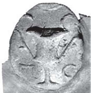
Рис. 3. Мерное клеймо с легендой \lambda\omicron (λεως) (по: Fedoseev 2016)