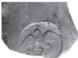
Рис. 12. Мерное клеймо, монетный тип «орёл» (по: Fedoseev 2016)