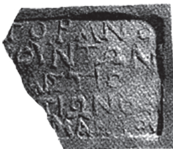
Рис. 17. Мерное клеймо агоранома, Мирмекий (по: Sarykin 2020a)