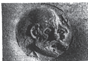
Рис. 11. Мерное клеймо, «говорящий» монетный тип: сатир (по: Saprykin 2020a)