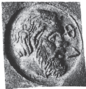
Рис. 8. Мерное клеймо, тип сатир + ΦΑ (по: Saprykin 2020a)