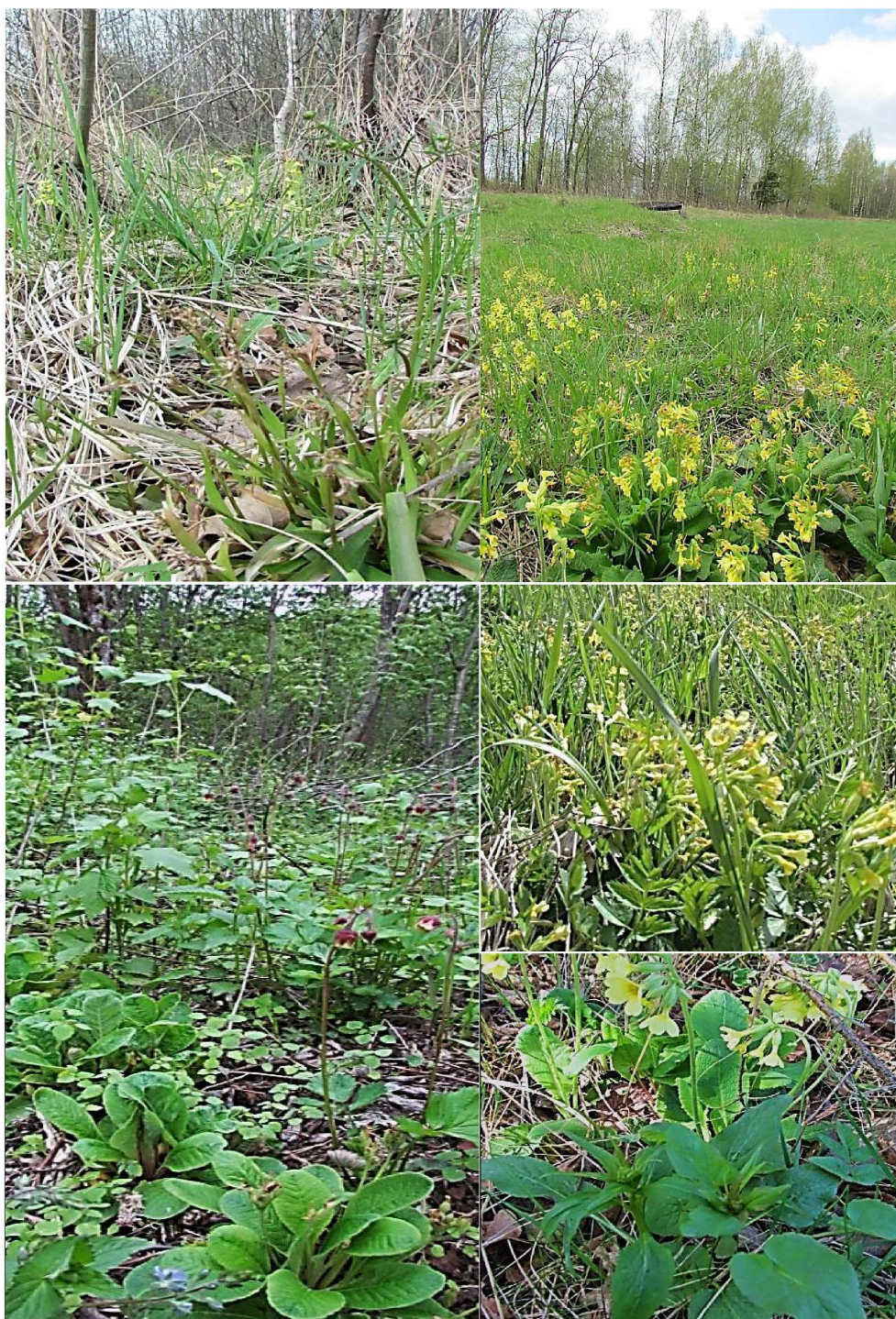
Рис. 1. Фитоценозы с Pimpinella major в окрестностях пл. 208 км (10.05.2020 г.) и около деревни Папино (внизу слева, 31.05.2020 г.)