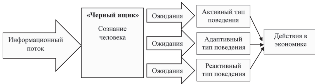
Рис. 3. Механизм осуществления действий в рамках поведенческого цикла