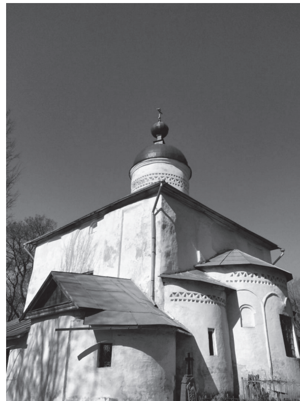
Церковь Жен-Мироносиц на Скудельне