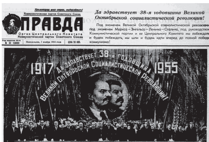
Илл. 3. Первая полоса «Правды» от 7 ноября 1955 года.