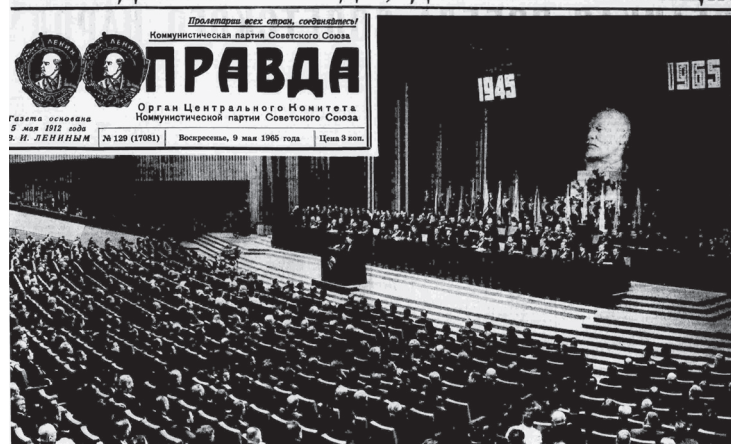
Илл. 5. Первая полоса «Правды» от 9 мая 1965 года.

В этом же номере «Правды» за 9 мая 1965 года неожиданно для риторики советской пропаганды тех лет появилось упоминание русского народа (отдельно от народа советского), что было совершенно не типично для публичного дискурса тех лет 35 . В номере была размещена заметка под названием «В благодарность русскому народу». В ней сообщалось, что представители УССР (Совет министров, ЦК Компартии Украины и Президиума Верховного Совета УССР) вручили представителям РСФСР «памятную медаль в ознаменование 20-летия освобождения Украины от немецко-фашистских захватчиков братскому русскому народу в знак глубокой благодарности украинского народа за активное участие в освобождении Украины от гитлеровских полчищ в годы Великой Отечественной войны». При этом медалью было