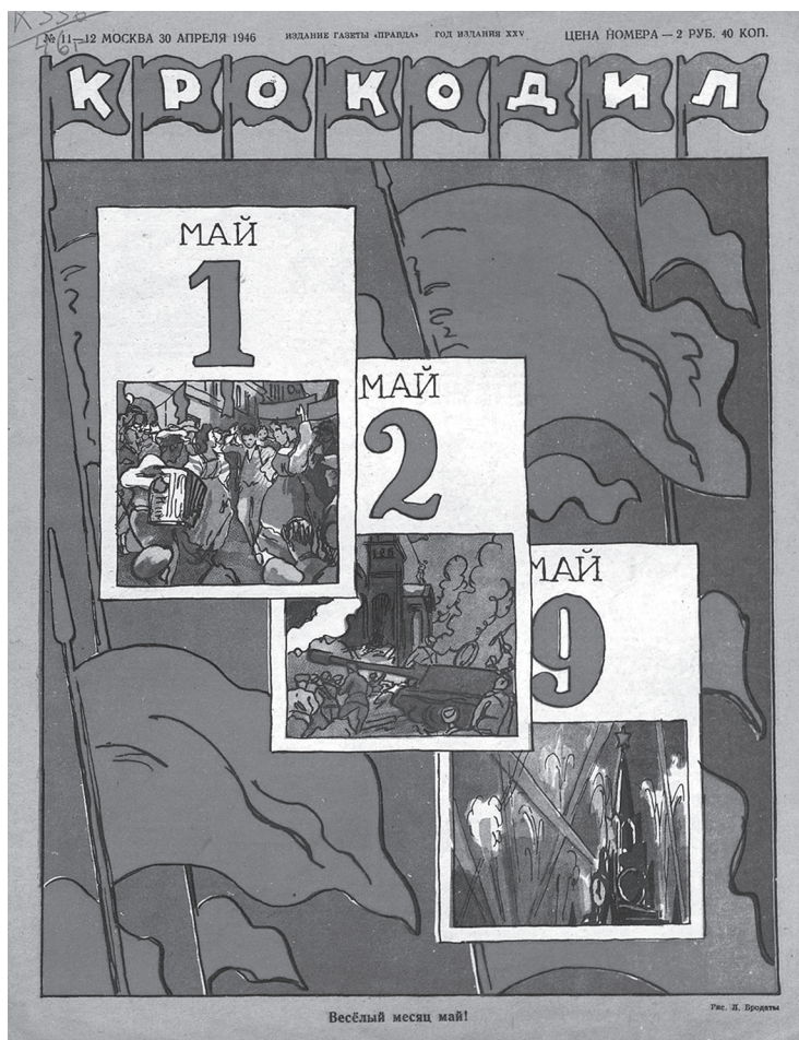
Илл. 1. Обложка «Крокодила» от 30 апреля 1946 года.